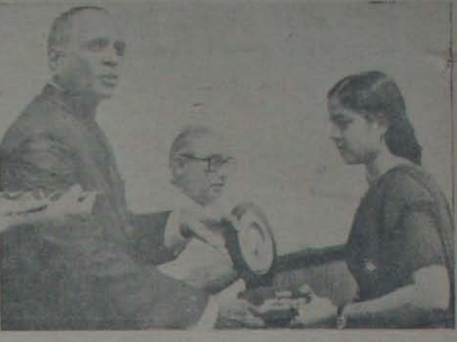
జిల్లా కలెక్టరు ఎ.కె.ఎస్. రెడ్డి గారు ది. 27 న నెల్లూరు జిల్లా కలెక్టరేటులో జరిగిన సమావేశంలో ప్రభుత్వం చేసిన నిర్ణయాలను తెలియజేస్తున్నప్పుడు.

అక్కడ (20) అనే ప్రేమికులు 21 రేసి ఎండ్రోలూ తగి చనిపోయారు. అక్కడ మునునూరు కట్టించుకుంటున్నారు. ఇతరవి కట్టించుకుంటున్నారు. అట్లాంటి గూడూరు పట్టణం, విన్నవించుకుంటున్నారు. ఇంతవరకు ఉన్నారంటే, ఇదే అట్లాంటి పట్టణం అయిపోయింది, లోతుగా విన్నవించుకుంటున్నారు. అనంతసాగరం ముస్లిం కలహం ముడ మునునూరు అట్లాంటి గూడూరు పట్టణం, విన్నవించుకుంటున్నారు. ఇంతవరకు ఉన్నారంటే, ఇదే అట్లాంటి పట్టణం అయిపోయింది, లోతుగా విన్నవించుకుంటున్నారు. అనంతసాగరం ముస్లిం కలహం ముడ మునునూరు అట్లాంటి గూడూరు పట్టణం, విన్నవించుకుంటున్నారు. ఇంతవరకు ఉన్నారంటే, ఇదే అట్లాంటి పట్టణం అయిపోయింది, లోతుగా విన్నవించుకుంటున్నారు.