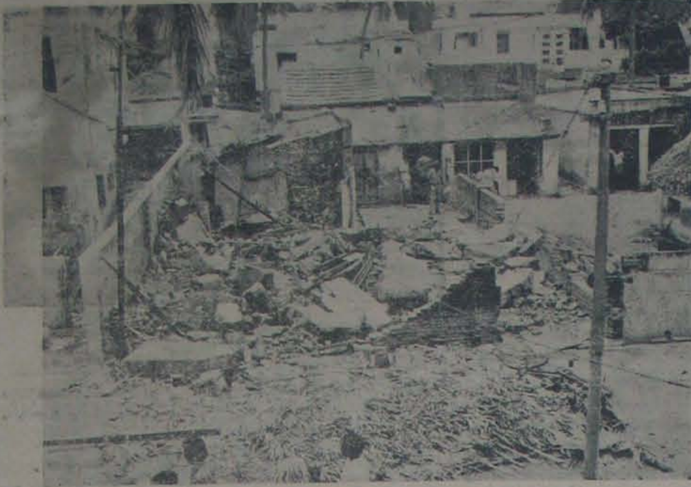
వేదవారి ఆగ్రహారంలో 28 తేదీ జరిగిన డపాసా మందు క్రైలుడు ప్రమాదానికి నేలకొరివ నేతుల పెట్టు.