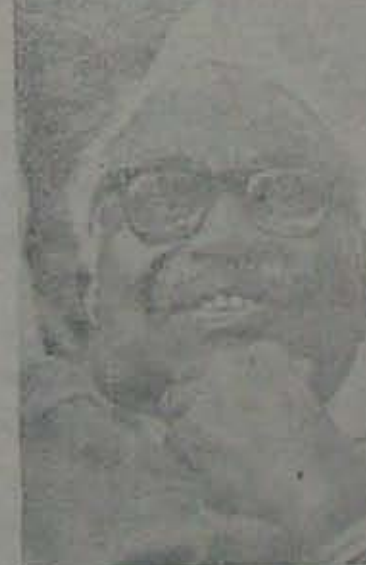
హరిజన సంక్రం: 11 కారం

జరిగింది గ్రామీణ ప్రాంతంలో కాదు; హరి జన గిరిజనాది దంపీన వర్గాలలో కాదు. దేశంలో విప్రధానమైన నాలుగు నగరాలలో జరిగిన ఈ అభిప్రాయ సేవకరణలో పాల్గొన్న వారు రాజకీయంగా విచేతనం కుండు, విద్ధాన వంతులు, తెల్లనవంతులు. పూర్వాసరాలు తెలిసి, మంచి చెడు తెలిజ చేసుకొని, ఒక