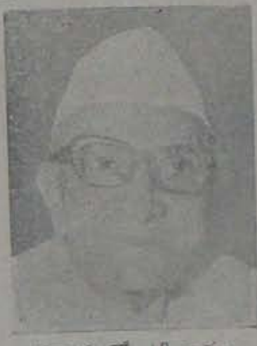
సన్యాసంలో 19 కారం

వాక పా మ, మొరార్జీ, చవాక - ఈ ఐదు మందిలో ఎవరు ప్రధాని కావాలని మీ కోర్కె అని జరిపిన ఓపీనియన్ పోల్ లో వరితాలిట్లా వచ్చాయి - ఇందిరాగాంధీ : 48 కారం మొరార్జీ : 18 ,, అగ్ని వన రాం : 14 ,, చవాక : 11 ,, తెలియదు : 8 ,, ఇక్కడోక ము అక్క మై న కెవరం గు ర్థుండుకోవారి ఈ అభిప్రాయ సేవకరణ