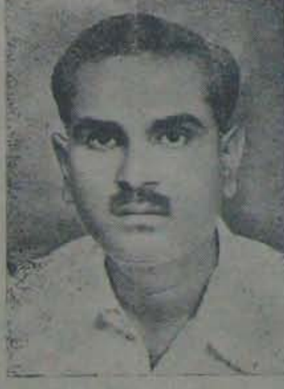
పూజ్యులు మా పినతండ్రి

ఇందిరాగారికి దాపో' అనడానికి చరణ్ అంగీరించలేడు. మధురీమాయి, బహుగుణ, చంద్రశేఖరయ్యాదె. ఈ నాయకత్వం చరణ్ కు గట్టనలపో యిచ్చింది. ఇందిరాగారికి తొంగిపోల్లని, చరణ్ ము బంపర్లడం తప్ప ఆమె కు గత్యంతరం ఉండదని వీలు ఉపాంబారు. ఇంకేమి చరణ్ రాజీనామా చేస్తాడనగా తోకా (అగస్టు 19) దాకా ఈ నాయక త్రయం ఇందిరాగారి దిగినవ్వడనే ఆలో ఎదురుమాటలు. కానీ రిజా పట్నాయక్, రాజ్ నారాయణ్ సంజయ్ నునే