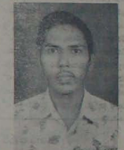
ప్రపంచ ఈ యువకవిమీద కానిగ - కన