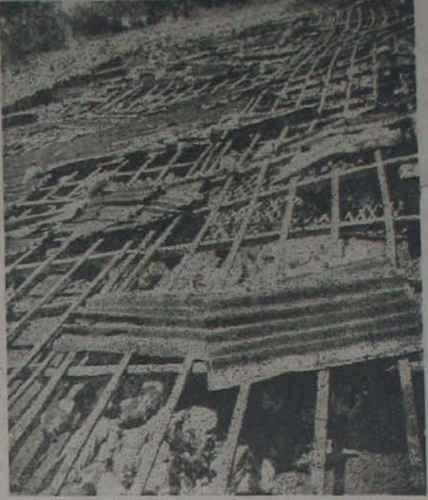
కుప్పూరిపోయిన ఒక కోళ్ళ పెంపక కేంద్రం