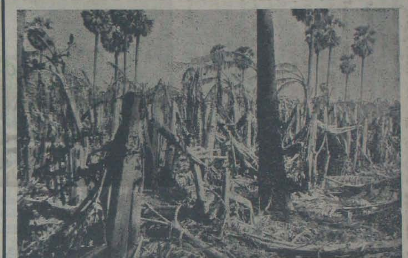
తుపానులో తునాతునకరైపోయిన ఒక అరటితోట

ఆ కొత్తపంగంలో దాదాపు 80 గుడిసెలున్నాయి. అందరూ యానాడులు, ఎరు కలవాళ్లు. శనివారం తుపాను దాటి ఒక్కొక్కగుడిసె రెగిన గారివలంవలె ఎగిరిపోతుంటే ఆ నిరుపేద నిర్వాగ్యులు పొగ్గిరాదు అరచేతపట్టుకొని చెట్టుకొకరు పట్టుకొకరయ్యారు. ఆ గుడిసెల మధ్య ఒక గడ్డిచామిఉంది. రాత్రి గాలివాన మరీ విజృంభించడంతో ఒక పదిహేనుమంది ఆ చామిలో నందులేసుకొని దూరుకున్నారు. రాత్రంతా అందులోనేవుండి. ఉదయం తుపాను తగ్గుముఖం పట్టినా తేనుంగా