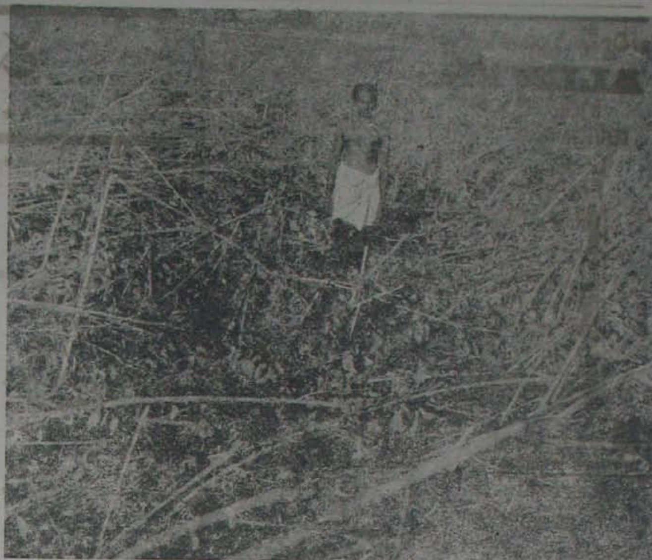
సుగ్గునూరు అయిపోయిన ఒక తమలపాకులతోట

గ్రాఫర్లు పట్టుకొని తమలా లాక్కొని పొమ్మన్నారు. అతడు తాగొచ్చే వడే సరికి, అందులోని పిక్చర్ లాక్కొని, తమలా ఇచ్చేసి వెనక్కు-తిరిగకుండా పరుగెత్త మన్నారు. అంతటితో సదరు దరమ పెలుపులుకూడా ఆ ఇస్తాలక్కడే పడిపోయి కాలికి బుద్ధిచెప్పారు, అది సంగతి! *