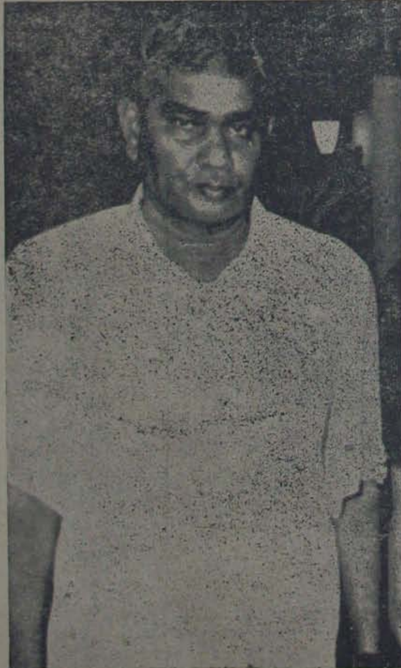
మరణం : 28 మార్చి 1978