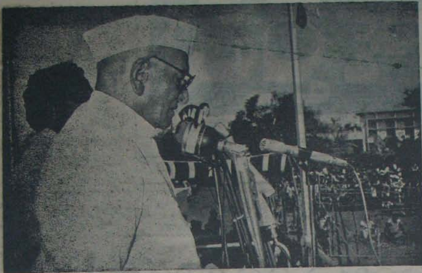
నెల్లూరు సభలో ప్రధాని మొరార్జీ ఉపన్యసిస్తున్నారు. ప్రక్కనవున్నవారు రెపిన్యూమంట్రి ఆనారనరెడ్డి.