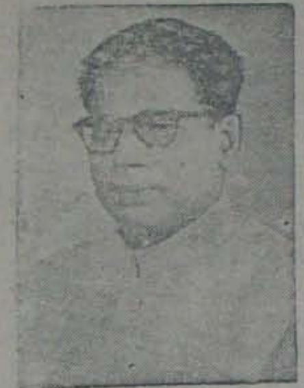
27 మేలో పాటు ఏకదాటిగా అధికారం నెరఫి ఆంధ్రలో ఒకసారి 'కింగ్ మేకర్' పాత్రవహించి 6 తేదీ ధర్మిలో పరమపదించిన కొత్త రఘురామయ్య

నిర్మాణం ముందు బరగవలసింది సముద్ర తీర గ్రామాలలోనే. ఆ అవసరాన్ని గుర్తించి, ఆంధ్రం లోకంకా ఆ కార్య కర్మమాన్ని చేపట్టినందుకు మా లో బాట మీరూ చెన్నారెడ్డిగారి ప్రభుత్వాన్ని మన సారా అభినందిస్తారనుకుంటాము. రైతాంగం పొందిన నష్టానికి కోరూరు పాటు ఒక మచ్చుకునది. నేల కరడుకున్న తమలపాటు తోటలను, నిలువునా విరిగి పోయిన అరటితోటలను, గాలికి విడిచిపెట్టిన వరిచేను మీరు అక్కడచూస్తారు.