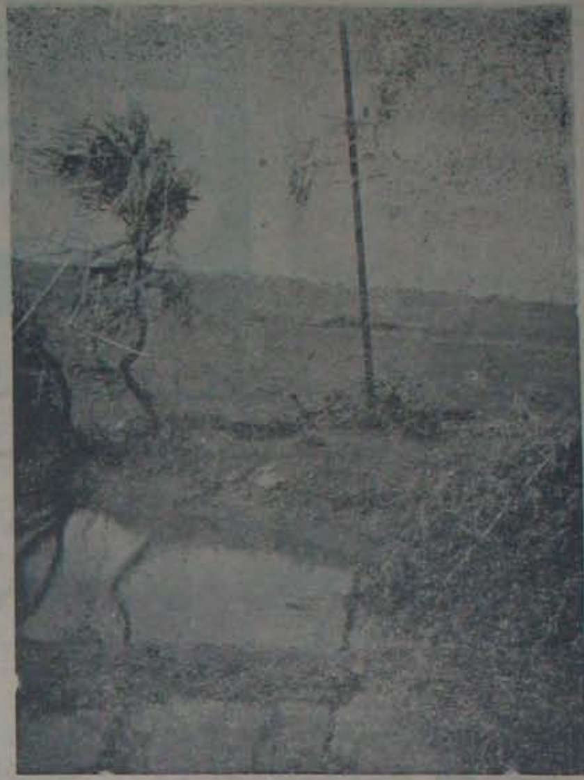
ఊళ్ళపాశెంపడు సముద్రపు నీరు ఉపైకెత్తుకు పొంగింది. రెరిగ్రాఫ్ తీసేసి, చెట్లకు తగులుకొనివున్న చెట్లె వీటిమట్టానికి గుడ్డు.

ప్రశ్నలు గానే వున్నాయి. అరికారులు తిరామరిగి చెప్పన్న గుడ్డిచెక్కెడ తప్ప ఏ నష్టం, కష్టం ఎంతైందీ ఇదే మిట్టంగా తెలలేదు. జిల్లాలో రెండులక్షలా 20 వేల 787 ఇళ్ళు కూలాయని, 15వేల పశువులు, లక్ష 20 వేల గొర్రెలు చచ్చాయని, మొత్తంమీద 228 కోట్ల రూపాయల నష్టం జరిగిందని కలెక్టరు చెప్పన్నారు. ఇవి బట్టితప్పిన లెక్కలని చెప్పడానికి లేదు. ఊళ్ళకు ఊళ్ళే ఆక్షుకపోయిన సమయంలో నష్టం ఇదీ అని అంచనా వేయడం ఎట్లా సాధ్యమౌతుంది. దావుల పరిస్థితికూడా అంతే. సర్కారు వారి లెక్కల ప్రకారం తాలూకావారీగా దావులివి: ఒంగోలు: 51; కందుకూరు: 328; కనిగిరి: 88; పొదిలి: 5; దర్శి: 1; మార్కాపురం: 4; అదంకి: 1; చీరాల: 6; మొత్తం: 485, ఇవికూడా ఏ ఆధారంలేని కారవ 7 వ పేజీలో