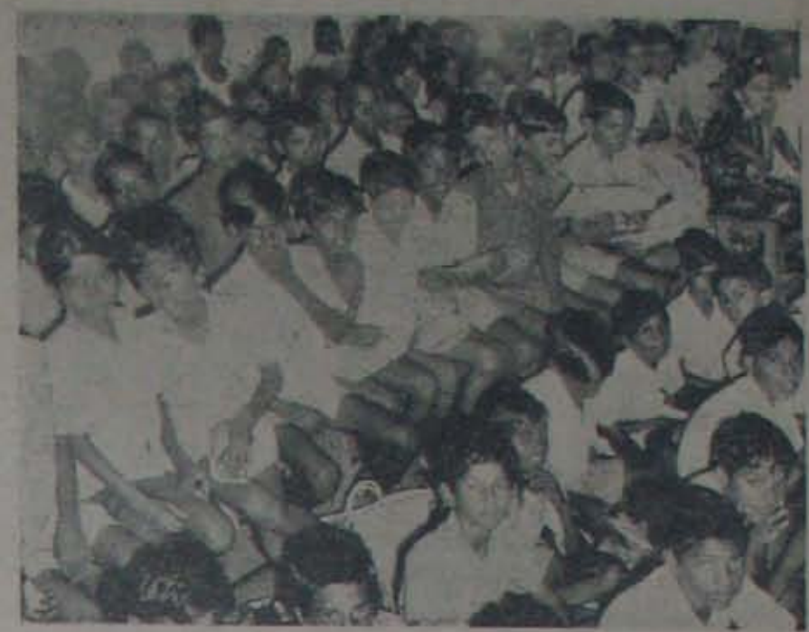
నెల్లూరు జి. ప. హైస్కూలులో కిటికీలాడుతున్న ఒక క్లాసురూము