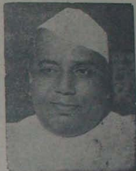
ఉపాధిపతి అద్యక్షం ఉపప్రధానిత్వం

తన సమరవంతుగాను, విప్లవకంగాను నెరవేర్చారనే అనాలి. ఎవరిబలం ఎంత, ఎవరిది ఆధిక్యత, ఎవరెవరి జాబితాల్లోని సంఖ్యలెంతంత-అన్న ఉత్కంఠతో దేశం యావత్తూ ఎదురు చూస్తుండగా, అందరిరప్ప రాష్ట్ర పతి నిర్ణయమీద