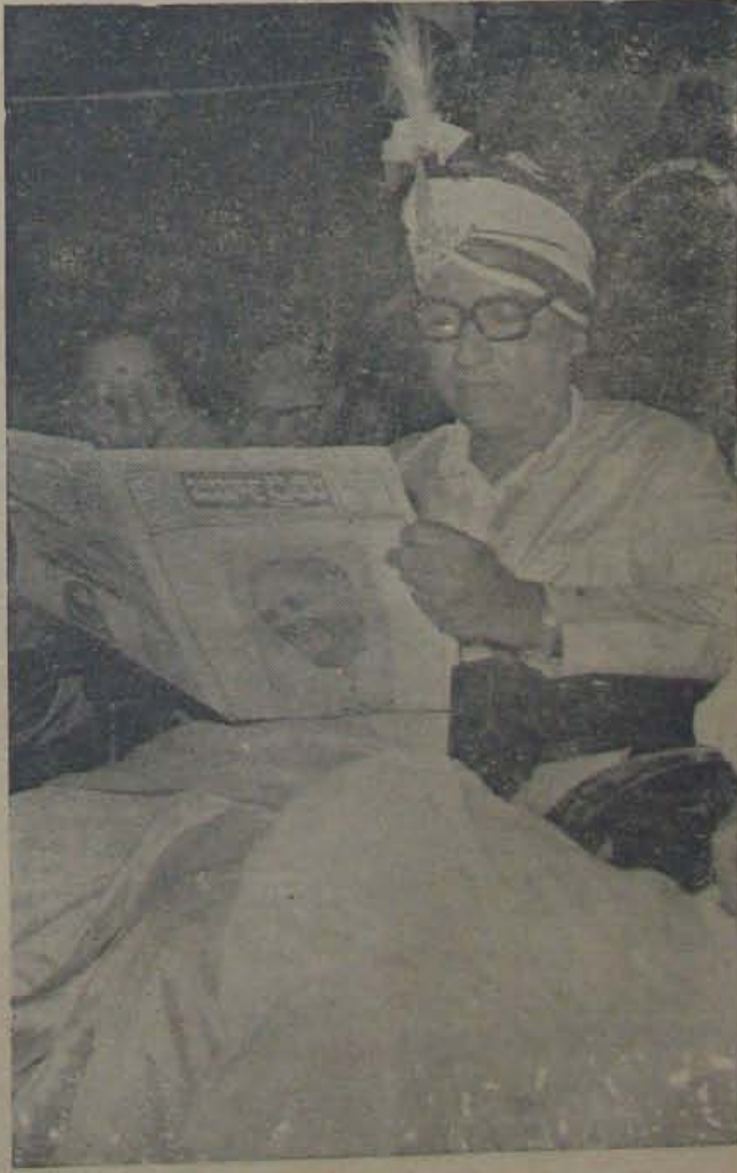
సభావేదికమీద 'జనాభారేతు' లో నిమగ్నమైవున్న ముఖ్యమంత్రి