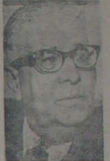
ఉపరాష్ట్రపతిగా నిర్ణీతగా ఎన్నికైన సుప్రీంకోర్టు మాజీ ప్రధాన న్యాయమూర్తి శ్రీ హిరయశర్మ

ఎవరైతే మున్నయ నాల్గై కుండిని అదనంగా గద్దెగా సమకూర్చుకోగలగూతాకో గెలుపు ఓటమీలు వారివేనని అంటున్నారు. ఎ. డి. ఎం. తె., ఆకాశీవ్ తర్కంబం ర్షిలరమల్లర పార్టీలు, వ్యక్తులు గోడ మీద కూర్చోవున్నాడు, పరిస్థితులు పరిశీ లిస్తున్నారు, గెట్టేవాడికే మా ఓటు అనే కోరికతో వున్నారు. మూ ర్షిస్తుం చునను తెలియడంలేదు. ఇతర వాచు పజింవారి ఆలోచనలు ఎట్లన్నాయో తెలి యడంలేదు. వీరందరి అనిర్ణయ వైఖరే కాకుండా ప్రధాని చరణ్ సింగ్ ను ఎదు కొన్న ప్రమాదాలు రెండుమూడున్నాయి.