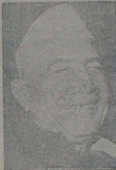
గందం గడుస్తుంది: గద్దె దిగవలసివస్తుంది:

అందరి దృష్టి ఆగస్టు 20 తేదీ మీద వుంది. చరణ్ సింగ్ ప్రధానిత్వం మూర్ఖత్వ ముచ్చటవుతుంది. ఆయన గందం గడిచి బయటపడతాడా? అనేది ప్రతి పెనవిమీద ఆడుతున్న ప్రశ్నలు. ఈ ప్రశ్నలకు బచ్చిరంగా సమాధానం చెప్పగలిగినవారు ఎవ్వరూ లేరనిపిస్తుంది. కప్పం కత్తిడతూకం ఎంత బరారుగా వుంటుందో, చరణ్ సింగ్ ప్రభుత్వ ధవి స్వత్వం గూర్చి అంచనా వేయడంకూడా అంత కఠిన్ గా వుంటుంది!