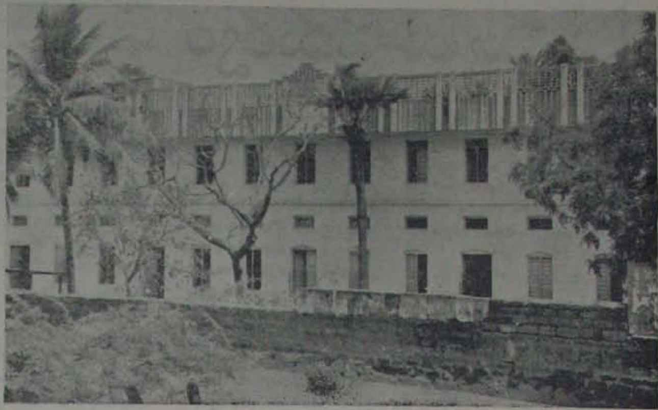
స్వర్ణోత్సవం జరుపుకున్న అల్లూరు - రామకృష్ణ జూనియర్ కాలేజి

స్వర్ణోత్సవం, వర్తమానం, వర్తమానం, వర్తమానం... ఈ యాద్యుక్త లో రామకృష్ణ జూనియర్ కాలేజి ఏర్పడిన మొదటి రోజును సమర్పించింది. ఈ యాద్యుక్త లో రామకృష్ణ జూనియర్ కాలేజి ఏర్పడిన మొదటి రోజును సమర్పించింది.