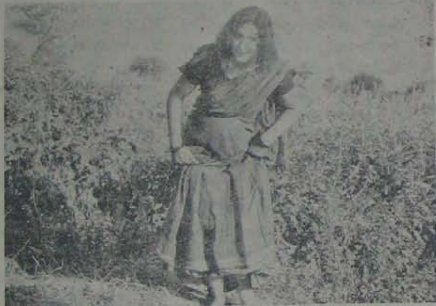
సరికొత్త 'పందేమాతరం' లో సరికొత్త కాంక్షనూరి

OBER HAUSEN (పశ్చిమ బర్మీ) అంతర్జాతీయ లఘు చలనచిత్రోత్సవం ఈ నెల 21 నుంచి 30 వరకు నిర్వహించనున్న రజతోత్సవం లఘు చిత్రాలపై 10 వ పేజీలో