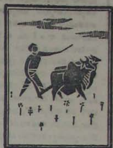
తెగులుకు ఒక మోస్తరుగా తట్టుకొనగలవని తెలిసింది.

అకుమచ్చ తెగులు బి. ఇ. డి. 4140, బి. ఇ. డి. 4141, బి. ఇ. డి. 2815 వరిరకాలు అకుమచ్చ