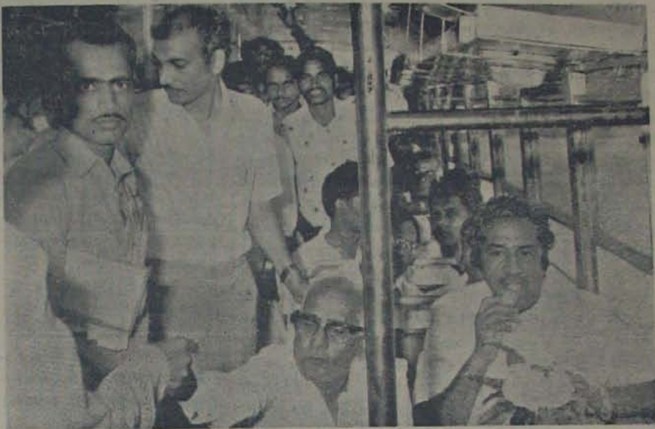
2 వ తేదీ కోవూరుకాలానా దవకపల్లెలో ఆర్. డి. సి. బస్సుకు రెవిన్యూమంత్రి బనారసరెడ్డి రిప్పకా కత్తిరింది, ఆ బస్సు లోనే ప్రయాణిస్తున్న దృశ్యం. అయినవక్కన ఎమ్మెల్యే పెళ్ళిగారు, ఆర్. డి. సి. తిల్లామీదేదరు సిహెచ్. డి. సుబ్బారావు.

మాజీ ముఖ్యమంత్రి శ్రీ అంగం వెంగళ రావు జనీ రాజకీయరంగంలో వికాసక పడే అవకాశాలు కనువిస్తూన్నాయి. విమోచ నా లోకమివ్వక రిపోర్టుకోసం ఎదురుచూస్తు న్నట్లుంది. అది రావడమే తడవుగా అయిన తిల్లామీద వడవచ్చు. ఏ వెంగళ రావుతో అయితే విభేషించి, అయిన మంత్రి సర్దంనుండి చైర్మని, అయినను దుమ్మెత్తి -కారక 8 క పేజీలో