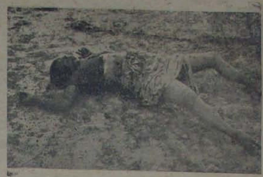
మైసూరు సముద్రతీరంలో 18 తేదీ రాత్రి హత్యచేయబడిన యువకుడు. ఆమె ఎవరైందో అంతుచూడక తలలేదు, ఆమె బాధువులైన వారిని రిపోర్టు చేయలేదు. వదిలిపోయి దానినా ఇదిగా మిస్టరీగానే ఉంది.

నెల్లూరు తిల్లా విక్రయదాత : టాబు ఎలక్ట్రానిక్స్ Sales & Service నెల్లూరు. ఫోన్ : 1212