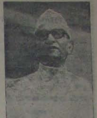
అందరి వ్యతిరేకతా ఏరిమీదనే!

నరోలో! పార్టీ అభ్యుదయ ద ప్రశ్నకో అవకు మొరార్టీ అభివృ అనుభవం. చాచోసింగ్ వానినుండి వ ప్ర శ్నకోను అందించాయ మొరార్టీ కాని వారిద్దరువర్గ అవంభం తెగిపోయి నట్లు వి కాటాగా ఉజ్జయినిలో చంద్ర శేఖర్ విసురు దారిం ధ్యవవయస్తుండి వ్యభుక్త్యం వంటివ తి దట్టవం ప్ర శ్నకో త్రివస్త్రుక వనశ్చుప్తివ్యక్తచేకాదు. ప్యభుక్త్య ప్రై పార్టీ వర్గర్ధు కొ. దా తిసు కోవాలని కోరుతున్నాడు. ప్రధాని, రాష్ట్రాల ముఖ్యమంత్రిలు మా రాల ని ధ్యనించేట్లు మాట్లాడుతున్నారు. ఆయన మాజిల్లో అసంతృప్తి, అనేదన, విరక్తి అన్నీ గూడుకట్టుకొని వున్నట్లు కనవకు తుంది. ఘోషించేకూడా జనతాపార్టీ, జనతా ప్రభుత్వాల పెదవ్రజల్లోకి పోలిక పోయాయని కుండ బ్రద్దులు కొట్టినట్లు వెలి