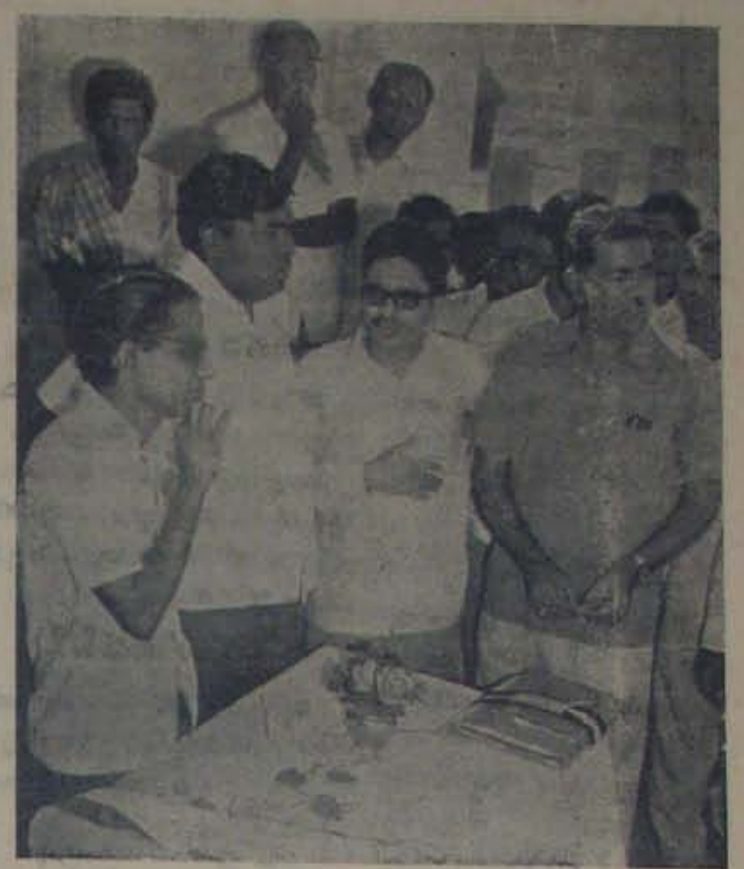
అమంబర్ల కాలనీలో 5 కేంద్రాలను ఏర్పాటు చేయడానికి ప్రభుత్వం 40 ఏకరాల భూమిని మొత్తం 3 మంది అవిద్యార్థులకు ఇచ్చింది.

యముని మహిషపు లోహపుంటలు గుర్తొచ్చే తొన్ బస్సుల మిడిమేశం!