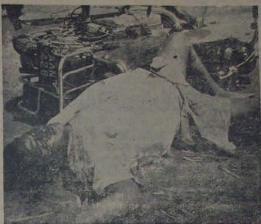
చెముడుగుంట వద్ద 6 తేదీ జరిగిన ప్రమాదవ్యవస్థం. మోటారు సైకిల్ మీద వెళుతుండగా వ్యక్తిని లారీ గుద్ది అంకుతుండా వెళ్ళిపోయింది.