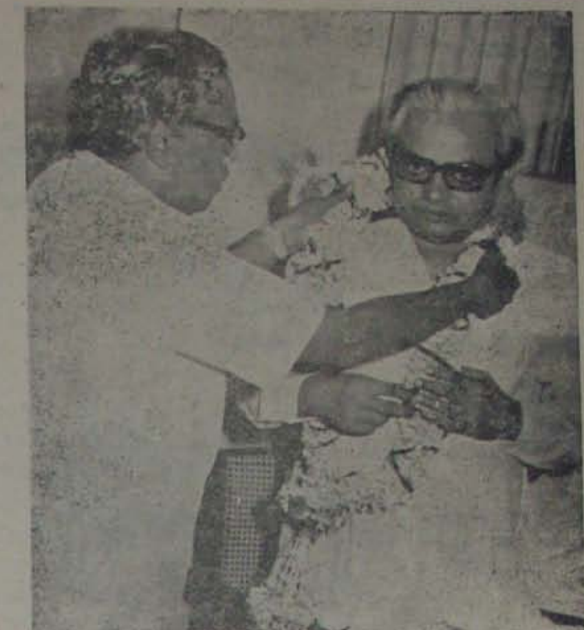
నెల్లూరు నుండి బి.ఎల్. అయిన అంధ్రాప్రదేశ్ రీజనల్ మేనేజర్ ఎం.వి.ఎస్.కె. దైనులకు 11 తేదీ, అధ్యక్షులు ఉద్యోగులు సి.డి.ఆర్.డి. పాఠశాలకు ఉపాధ్యక్షులు పన్నాగించారు. అదే ఈ దీక్ష.

కావలి నిరాహార దీక్షలు కావలి, రామకృష్ణయ్య బడి అనబడే ఎయిడెడ్ ప్రైవేట్ ప్రయత్నం స్కూలు ఉపాధ్యాయులు 22 తేదీ నుండి నమ్మక నిరాహార దీక్షలు చేస్తున్నారు. అన్నాల్లో తీవ్రత, మేనేజ్మెంట్ కు అధికారం కావాలి, అది రోజూ రోజూ పెరుగుతున్నాయి. తీవ్రతనుండి నమోదు చేసిన సి.డి.ఆర్.డి. మొత్తం మేనేజ్