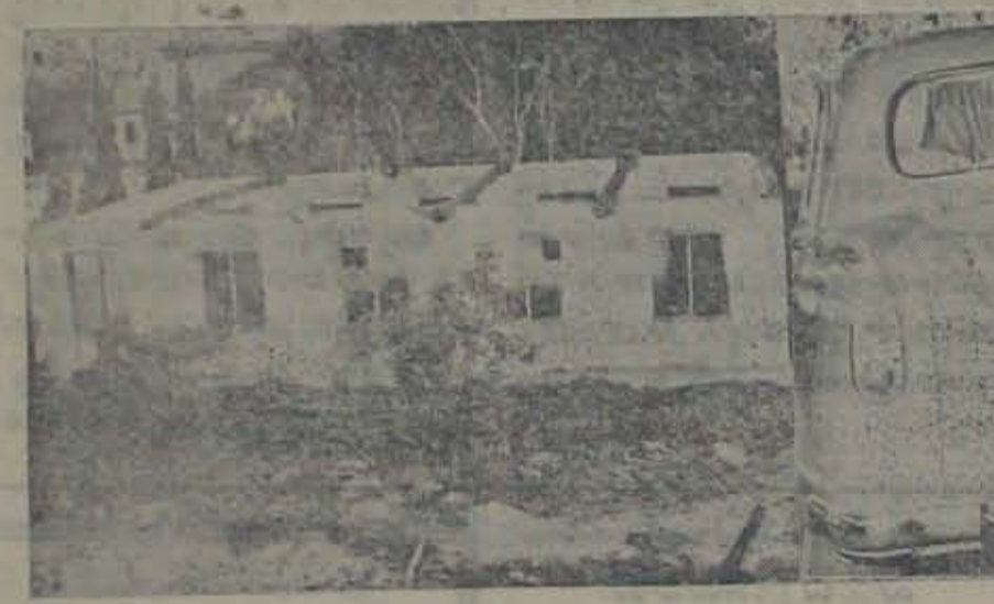
30 తేదీ విద్యానగర్ కాలేజీలో నివృత్త పెట్టబడిన క్లాస్ రూం మొదటిగోడలు. విద్యానగర్ లో ధ్వంసం చేయబడిన కల్లెక్కరు కారు.

600 మంది విద్యార్థులు గుంపుగానే వానా గండరగోళం చెయ్యడం, అధికారులను కిద్దూ, వెదిరిస్తూ నివాదానివ్వడంలో మొదలుపెట్టి, రాళ్ళు దవ్వడంకా వచ్చా రకు. డి. ఎన్. పి. కి దెబ్బ తగిలింది. అనా అధికారులు పిల్చి వహించినట్లున్నారు. ఒక డ్యూయివర్చు వట్టుకొని కొట్టారకు. ముఖ్యుపేకు సి. ఇ. గూడూరు కాన్స్టాబ్లర్లు పులు అక్కడ నిలిపివేసి, వాల్మీ తోను కొనివెళ్ళి కగంబెట్టారకు. అనా అధికారులు మౌనం వహించినట్లున్నారు. ఉదయం 8 గంటలనుండి 10 దాని వ్యవధి యిచ్చారకు. అలోగా వెళ్ళిపోమని కోరా