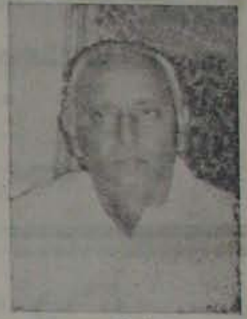
అసెంబ్లీ స్పీకర్ కొండయ్య చౌదరి