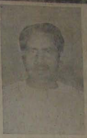
నెల్లూరు లంగర్ చుట్టల ప్లాకర్ల యజమాని

విడువోగానీ, మనదిల్లాలోని కాలేజిల కన్నిటికీ ఏదో ఒక అబ్బు వట్టెనట్లుంది. వెల్లారు సర్వోదయ కాలేజీలో లెక్కర్లు వచ్చేసేసి, నిరాచారీక్షలుసేసి, ఇకర కాలేజీలలో నమానంగా తీకాలు తెచ్చుకు న్నారు. కానీ ఆ వాటినుండి ఈ వాటిదాకా - అంటే రెండు నెలలుగా - చాళ్ళకు తీకాలి ఇవ్వలేదు. కావలి 'అవవారకాలతి' వలే, సెమిస్టర్ కిదానంలో ఉన్నకసానం చేర కొని, అదా న మ న కాగలదని అతిప్రీ, అది తున్నుమకపోయింది. వారాడు ఎన్. వి. కె. అర్. కాలేజీలో దిద్యార్థి యూని యకా ఎన్నికలు అరపాలంటూ నమ్మె ప్రారంభించాడు. కాలేజీ మూకబడింది. ఇట్లావుంది మనకాలేజిల ప్రింట్!