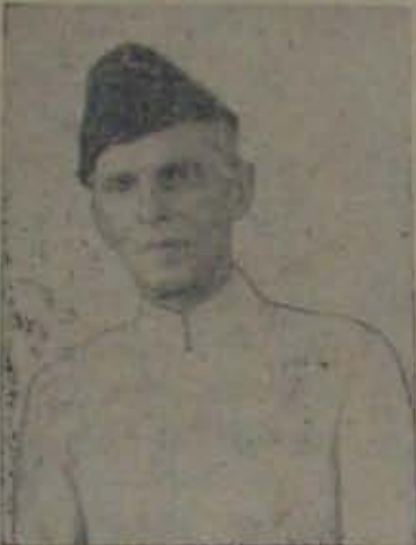
'క్యాంటి అజం' జిన్నా కోవడం అత్యంత విచారకరమైన వాస్తవం! ఇంతకన్నా విభూతమైన విషయాలు కూడా లేకపోలేదు. జిన్నా కు తెలిసిన ఉర్దూ బహుశ్యులు ఆరబిక్ అత్యల్పం. 'అద్వాయై' అనేదంకన్నా ఆయన

[1976 డిసెంబరు 25 తేదీ వచ్చిన మహమ్మదాబాద్ కింకా 100వ వ్యవధి. ఆ సందర్భంలో యిప్పుడు వ్యాసం 20. -సం.]