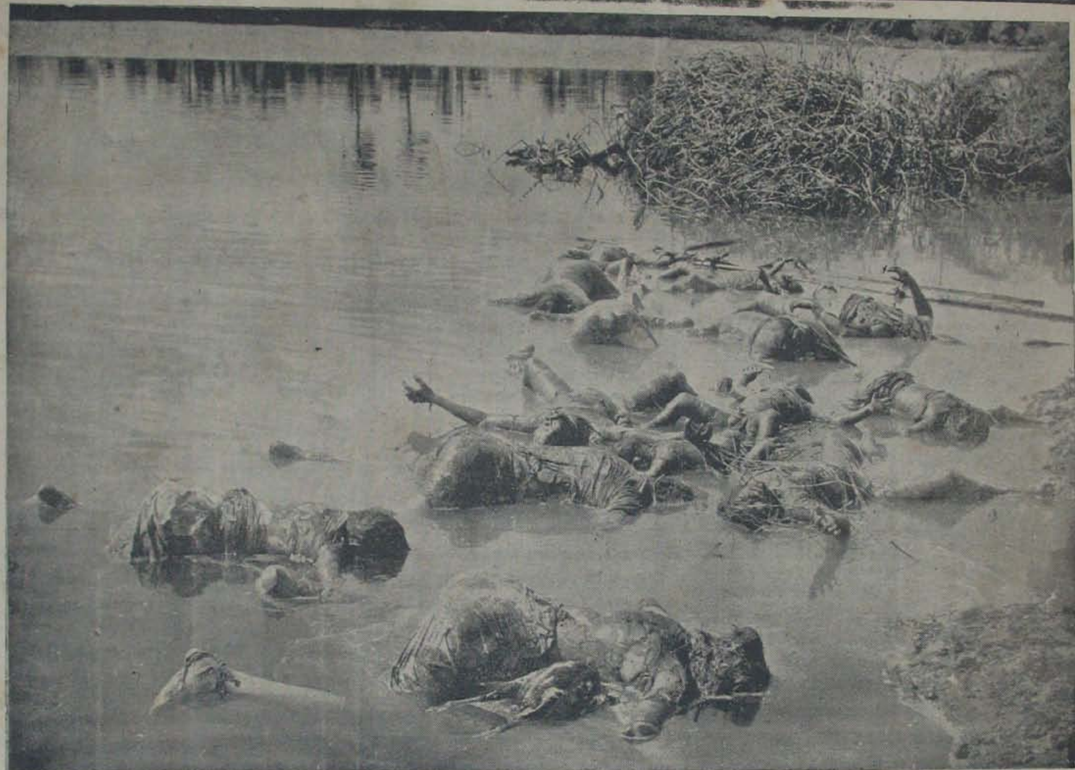
దివిసీమకాదు, దిక్కులేని శివాలనీమట్ల ఖావదేవరపల్లెలో కడుపు తడుక్కుపోయే ఒక విషాద దృశ్యం