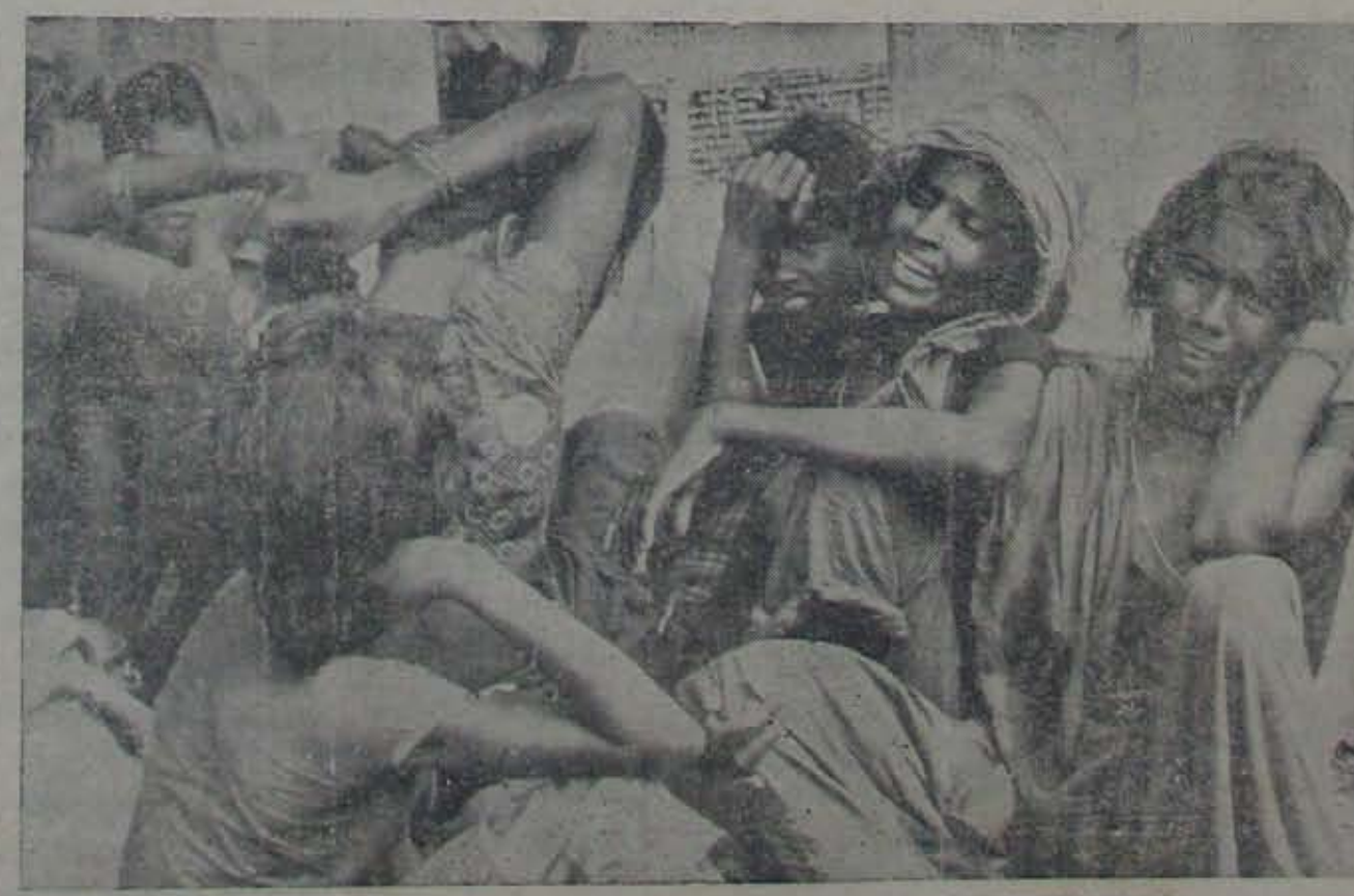
"అంకేమి మిగిలింది ఎత్రి మా బతుకులకు? కన్నీరు కడుచెంది, కడుపు చెరుచెంది."

తరలను నిధులను నా అనేవారిసందరిని ఉప్పునకు భారపోసుకొని విరాళాలై కన్నీరు మున్నీరుగా విలపిస్తున్న డివిసెమ దిక్కులేని శ్రీ అనం.