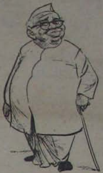
జనతాపార్టీకి విజయాన్ని మొరల్ ప్రభుత్వానికి సుస్థిరతను చేకూర్చిన జగ్ జీవేశారాం

50ఏళ్ళ ఫెర్నాండెజ్ గోవా ప్రాంతీయుడు. జిల్లా వుదాక లూపించగల వర్త. బొంబాయి నుండి ఒకసారి లోక సభకు ఎన్నికైనాడు; 1971లో ఒడిషోయాడు క్రైస్టియన్లు అధ్యక్షియంగా నడిపాడు, అతరున విఫలమయ్యాడు. బరోడా వైనమేజ్ కేసులో ప్రధాన ముద్దయిగా వుండి, కైలులో కూర్చోని, నీహారు నుండి దేశంలో ఎక్కడికీ రానంత మెటారిటీతో ఎక్కడైరాడు. ఫెర్నాండెజ్ కమ్యూనికేషన్ల మంత్రి అంటే పి అంటే అన్నమాట.