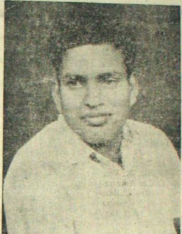
ఆర్య సంస్కృతి విలసితుడు, నిరాడంబర శుద్ధ సత్య మానవతావాది, పుత్రకామెప్పి మహాయాగ పునీతుడు

కాంగ్రెసువారిలో ప్రకాశం, కాళేశ్వర రావు మొదలయిన ఆంధ్ర ప్రాంత నాయ కులు ఇది కమ్యూన్ షుల భావం అనే విచారము దిక్కనింది దిశలాంధ్ర ఉద్య ముల్ల బలపరిచారు. అయినా అది అవర్ణ్య ప్రాతిపదికపైనే సాగింది. దిశలాంధ్ర అనాటికి ఒక కమ్మని ఉహ మాత్రమే. పొట్టి శ్రీరాములు త్యాగం మొగది భాషా వేయుక్త రాష్ట్రంగా ఆంధ్రరాష్ట్ర నిర్మాణం అనుకోవడా జరిగింది ఉమ్మడి ప్రాధానురాష్ట్ర వ్యభుత్వంలో ఉన్నత పదవులు అధిష్టించిన అధికారులు, అనది భావలు వినాడూ ఆంధ్రరాష్ట్రం ఏర్పడితే రాజధానిగాగల మహావట్టణం ఏర్పాటు చేసుకోవాలని కృషిచేయలేదు. కొందరు వద్యాసు మనకే వస్తుందనుకొని వుండ వచ్చు కొందరికి ఆంధ్రరాష్ట్రా ఏర్పడు కుండా అని ఉదాసీనత కావచ్చు. ఏమయినా ఆంధ్ర విశ్వవిద్యాలయం -కొరవ 6 వ పేజీలో