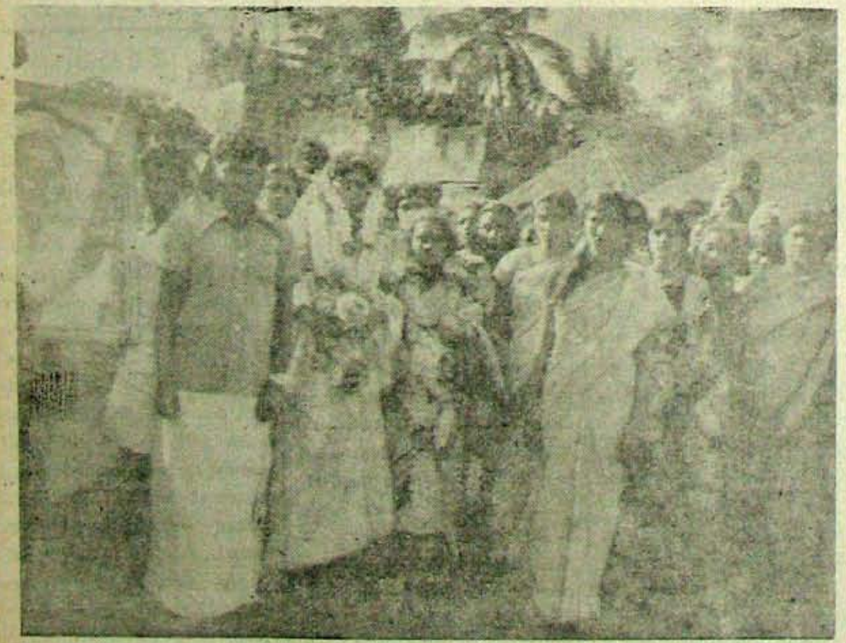
యాగానంతరం గ్రామోత్సవ దృశ్యం