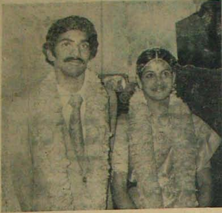
గూడూరు ప్రముఖ మైకా ఎక్స్‌పోర్టరు, సహృదయుడు