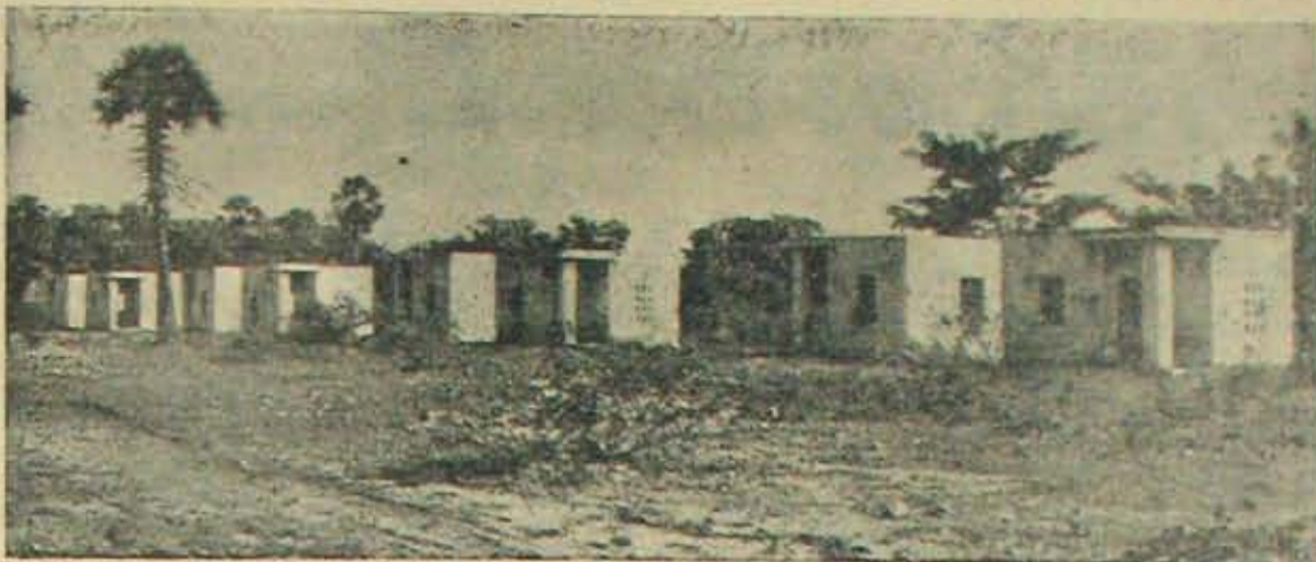
ప్రభగిరిపట్నం హరిజనకాలనీ బాళిగాలేదని, ఇండ్లు హరిజనులకు స్వార్థి నం చేయబడినవని పాదలకూరు నమిరి 'అభ్యుదయాధికారి' 1974లో అధికారయంతంగా అంధకనలో తెలిపాడు. 1976లో కూడా అలాంటి పాతుంటి వున్నదనుకువ్యక్తమై వుంది.

పి. డి. ఓ. గారి అంధకన నిర్దివతర్వాత మేము మాకు నాలుగుసార్లు విదారింది - కొరవ 8 పేజీలో