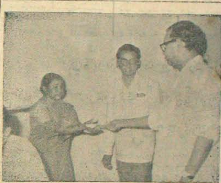
నెల్లూరు ఉపశాఖలోని ఆక్రమణలు తొలగించండి, ప్రత్యామ్నాయంగా కొందారు పాలెంలో స్థలాలివ్వబడిన హరిజన, గిరిజన, స్వర్ణకారులకు కలెక్టరాఫీసులో 13 తేది వట్టాలవంపకం చేశారు శేంద్ర కార్యకమంత్రి కె. డి. రమణారెడ్డి.

తిల్లాలలోకూడా తొలగించవలసిన వారి బావికాలు తొందరపడి తయారు చేస్తు న్నట్లులేదు. ఆయా అధికార, వ్యవస్థాగల గత చరిత్రలు పారబట్టి, కూలంకషంగా దర్శించి, పరిశీలించి, వున్నవరిశీలించి తయారు చేస్తున్నారు. ప్రతిశాఖలో ఈ విధంగానే జరుగుతున్నట్లంది. ఏ తిల్లాకు ఆ తిల్లా కాకుండా, కొన్నికొన్ని తిల్లాలు కలిపి, ఆయా వున్నకాదికారు సమాలోచ నలు జరిపి తర్వాత చర్యలకువక్రమిస్తు న్నారు. బావికాలు తయారు చేయడంలో,