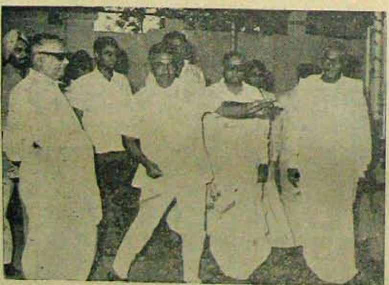
వికృతానికి సంబంధించిన అని చాలా మందికి తెలియదు; తెలిసినా కొందరు అర్థంకానట్టే కృత్యం చేస్తున్నారు. కాననబద్ధమైన సాంఘిక, రాజకీయ శీలికాలు గడిపే సామాన్యజనానికి అత్యవసర పరిస్థితివలన ప్రకాశక అనుకోసం తగాలంక మయింది. మనచుట్టూ ప్రపంచం అకాశికో కల్లోలంగా ఉండాలని, దాని వలన ప్రభుత్వంపై నెత్తనం సాగించి వల్లం గడుపుకోవాలని అనుకోసేవారికి మాతం యీ అత్యవసర పరిస్థితి అకా ధంకం కలిగింది. వారే యీ పరిస్థితిని

కాని శేంద్రనాయకులుకూడా యీ పరిస్థితిని యధావధంగా ఉంచాలనుకోవడం లేదు. అట్లా ఉంచడంకూడా సంకీర్ణం కాదు. కాని గత రెండు దశాబ్దాలుగా కాంగ్రెసు వాగ్దానం చేసిన సంస్కరణలు సార్వమయినంత త్వరగా పూర్తి చేసి, ఆర్థిక స్వాతంత్ర్యానికి సుస్థిరతను చేకూర్చాక ఈ అత్యవసర పరిస్థితి తొలగిస్తారు. ప్రభుత్వార్థి బహిష్కరణచే కార్యకలాపాలు వచ్చి ప్రారంభం కాకుండా వుండే రాజకీయ వాతావరణం ఏర్పాటు కావడంతో ఈ పరిస్థితి తొలగుతుంది. దీనికి కాలపరిమితి అని వుండదు కదా!