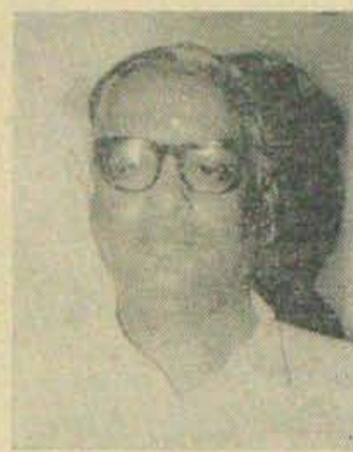
ఆ విధమైన అవగాహనకు దోహదమిస్తున్నది కనుకనే ఈ ఒప్పందాలు సాధ్య

దశాబ్దంగా పరిష్కారం కాకుండా మిగిలిన అలిమెల ప్రాజెక్టు నిర్మాణం సాధ్యం చేసు కొని వచ్చాడు. వివాదాల పెంచుకుంటే పెరగుతాయి; తెంచుకుంటే తీరుతాయి అంటారు. పరిష్కా రానికి మాత్రం మధ్యవర్తులకంటే ముఖా ముఖి దర్శనమేలని ముఖ్యమంత్రి వెంగళ రావు నమ్మిన సూత్రం. అందుకే మైసూరు, ఒరిస్సా రాష్ట్రాలతో ఒప్పందాలు చేరికయి నాయి. పొరుగు రాష్ట్రమంటే వ రాయి దేశం కాదని అనుకోవాలి. ప్రయోజనకర మైన కార్యాలు లాభనష్టాల అందనాలో కాక, బాతిమొత్తం శ్రేయస్సు దృష్టికో మా దా లి. ఈనాటి అత్యవసర పరిస్థితి