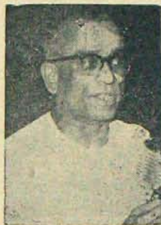
గౌరవంగా పునఃప్రవేశానికి మంచివేదిక దొరికింది!

కాని విశాఖ విద్యార్థులు చెప్పిన విషయాలు దేశంలో చాలామంది అభిప్రాయాలకు దర్శనమయ్యాయి. ప్రగతి నిరోధకత్వం అస్తిపాస్తులలోకాక దృక్పథంలో