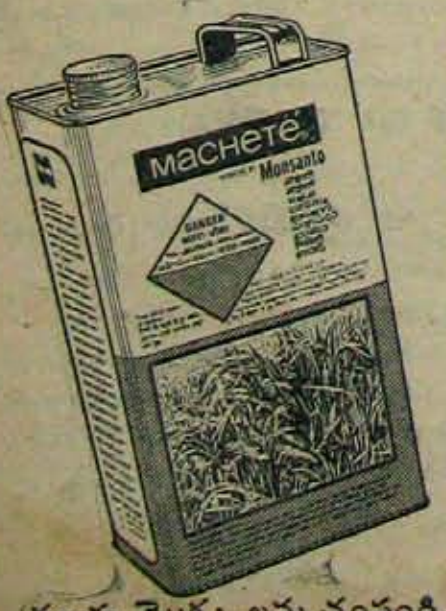
కలుపు మొక్కలను చంపండి- పంట దిగుబడిని పెంచండి

మోసాంట్ రెమికోల్డ్స్ ఆఫ్ ఇండియా ప్రైవేట్ లి., వాక్ ఆఫీస్: నెక్స్ట్ ఫ్లోర్, 11, స్ట్రాట్ రోడ్, రెల్లాట్ ఎస్టేట్, బొంబాయి 400 001. బ్రాంచీలు: 3/8 అవెన్యూ రోడ్, న్యూ ఢిల్లీ 110 001. 19 కాతేంద్రనాథ్ ముఖర్జీ రోడ్, కలకత్తా 700 001. 310/311 80ంగ్ రెల్లె ప్రీట్, మద్రాసు 800 001. మోసాంట్ - కలుపునాశక మందు తయారుచేసే దారతీయ వ్యవసాయదారులకు సేవ చేస్తున్నవారు © మోసాంట్ కంపెనీ చారి రిజిస్టర్డ్ ప్రీట్ మార్క్. వారి అనుమతితో మోసాంట్ రెమికోల్డ్స్ ఆఫ్ ఇండియా ప్రైవేట్ లిమిటెడ్ చారిటే ఉపయోగించబడుతుంది.