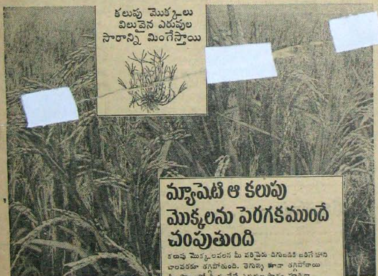
కలుపు మొక్కలు విలువైన ఎరువుల సారాన్ని మింగేస్తాయి

పి. పి. మరణం. మానవజాతికి వ్యభిచారోపిగా ఈ వ్యాధికి మనమైన చరిత్రవుంది. క్రీ. పూ. 2600 నాటి చైనా వైద్యశాస్త్ర గ్రంథాల్లో దీని ప్రస్తావనవుంది. అయితే అప్పటికి బ్లడ్ ప్రెషర్ నేది తెలియదుకానీ, ఆహారంలో ఉప్పు ఎక్కువ కావడం వల్ల నాడిరిధానం, రంగు మారిపోవడం ఆ గ్రంథాల్లో పేర్కొనబడివుంది. బ్లడ్ ప్రెషర్ వరితంగా వచ్చిన వ క్ష వా కం వల్లరా జబ్బుల్ని గురించి చైల్డ్ లో కూడా వు చట. ఐతే 17 శతాబ్దంలో బిలియం హార్ట్లెనే ఆ గ్రంథాల్లో బ్లడ్ ప్రెషర్ మొట్టమొదటిసారిగా మానవ శరీర రక్త ప్రసారణా విధానాన్ని వివరణాత్మకంగా తెలియజేసినదాకా ఈ బ్లడ్ ప్రెషర్ రకామాటు మనవజాతికి అంతమిట్టలేదు. అప్పటికైనా దాని స్వభావ మైతే తెలిసిందికానీ, 20 శతాబ్దంలో వైద్య నిపుణులు శరీరంలో ప్రవహించే రక్తం వర్తిడిని కొలిచే వద్దకి కనుక్కునేదాకా సమగ్ర అవగాహన అూ ఏర్పడ లేదనాలి. 1929 లో హార్ట్లె కు మోసిన డాక్టర్ సామ్యూల్ ఆల్బర్ట్ లెన్ అనే వైద్య శాస్త్రజ్ఞుడు 145 గుండెపోటు (Heart attack) కేసుల్లో 60 శాతం పి. పి. రోగులని తెల్పిచ్చేదాకా మనకీవ్యాధి దిక్కు కూడా సందర్భంకాలేదు! లెన్ న వరికో డింది చెప్పేదాకా, బ్లడ్ ప్రెషర్ నేది వయస్సు మీరిన రక్తనాళాల్లో రక్తం బలంగా ప్రవహించేయడానికవసరమేననే అభిప్రాయం వైద్యరంగంలో విస్తృతంగా వుండేది! మానవ శరీరంలో 60 వేల చైల్డ్ల పొడవున రక్తనాళాలున్నాయట. శరీరంలోని హెచ్చుతక్కువ ఒకటివారిక గ్యాస్ట్ రక్తం వివిధ రక్తనాళాల ద్వారా గుండె నుండి 'పంప్' చేయబడి శరీరానికి సరఫరా అవుతుంది. కాంతలో నిక్కు ఏడా అయితే గట్టును ఒక గుతుని ప్రవహిస్తాయి, —కొరవ 10 వ పేజీలో