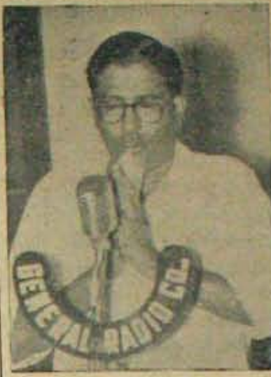
Ex : Proprietor for National Lodge, Welcome Hotel, Secretary for Nellore District Hotel's Association