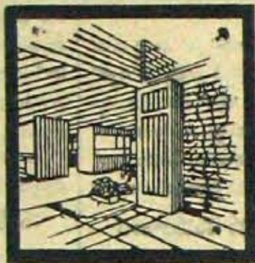
'FIXOPAN' PVC Panelling