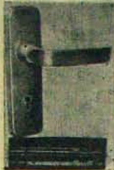
E. C. I. E Aluminium Products