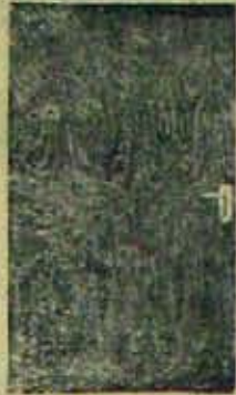
KUTTY'S Band wood Flush doors