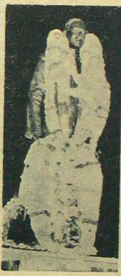
కొత్తరూపంలో వి. సి. కాన్వెన్షన్

నెల్లూరులో మధ్యతరగతి వారి పెళ్ళిళ్ళకు దిక్కుగావున్న సంస్థ ఇది. ముప్పయి యేళ్ళ క్రమానుగతాభివృద్ధితో నిధులు గిడులతో స్థిమితంగావున్న సంస్థ ఇది. కేవలం వైశ్యుల బౌద్ధార్యంలో, నిర్వహణలో ప్రజోపయోగంగావున్న సంస్థ ఇది