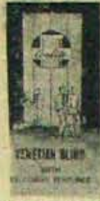
'COOLITE' Venetian Blinds