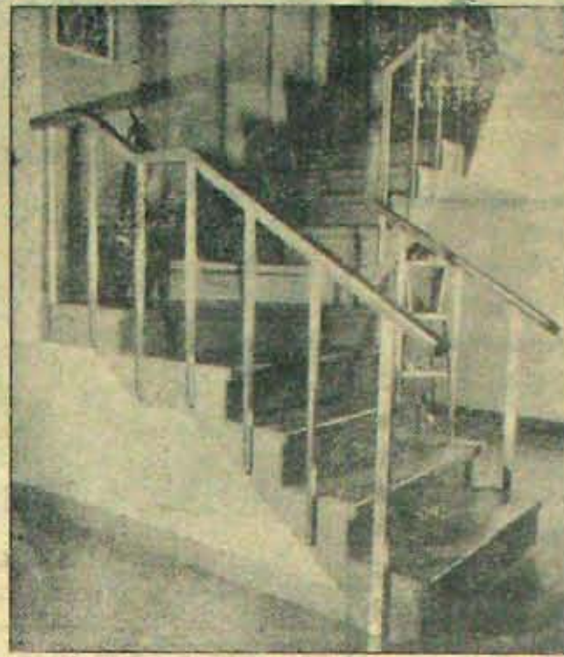
E. C. I. E ALUMINIUM STAIR CASE