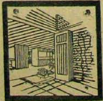
Fixopan P V C Panelling