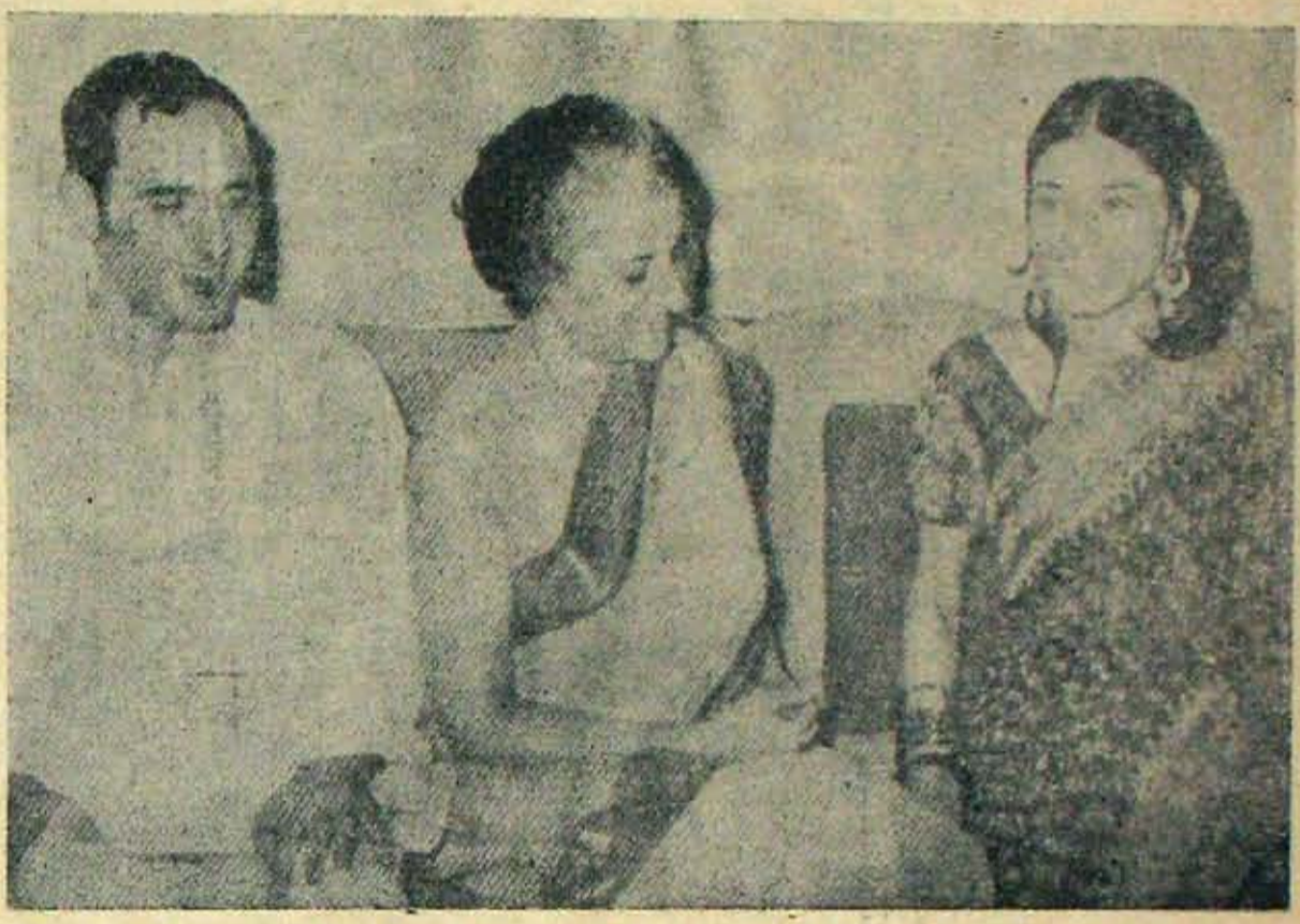
ప్రధాని ఇందిరాగాంధీ రెండవ భువారయ సంజయ్ గాంధీ, ప్రధాని, వరువు మేనక (మెండ్లి విశేషం ముగియడం)