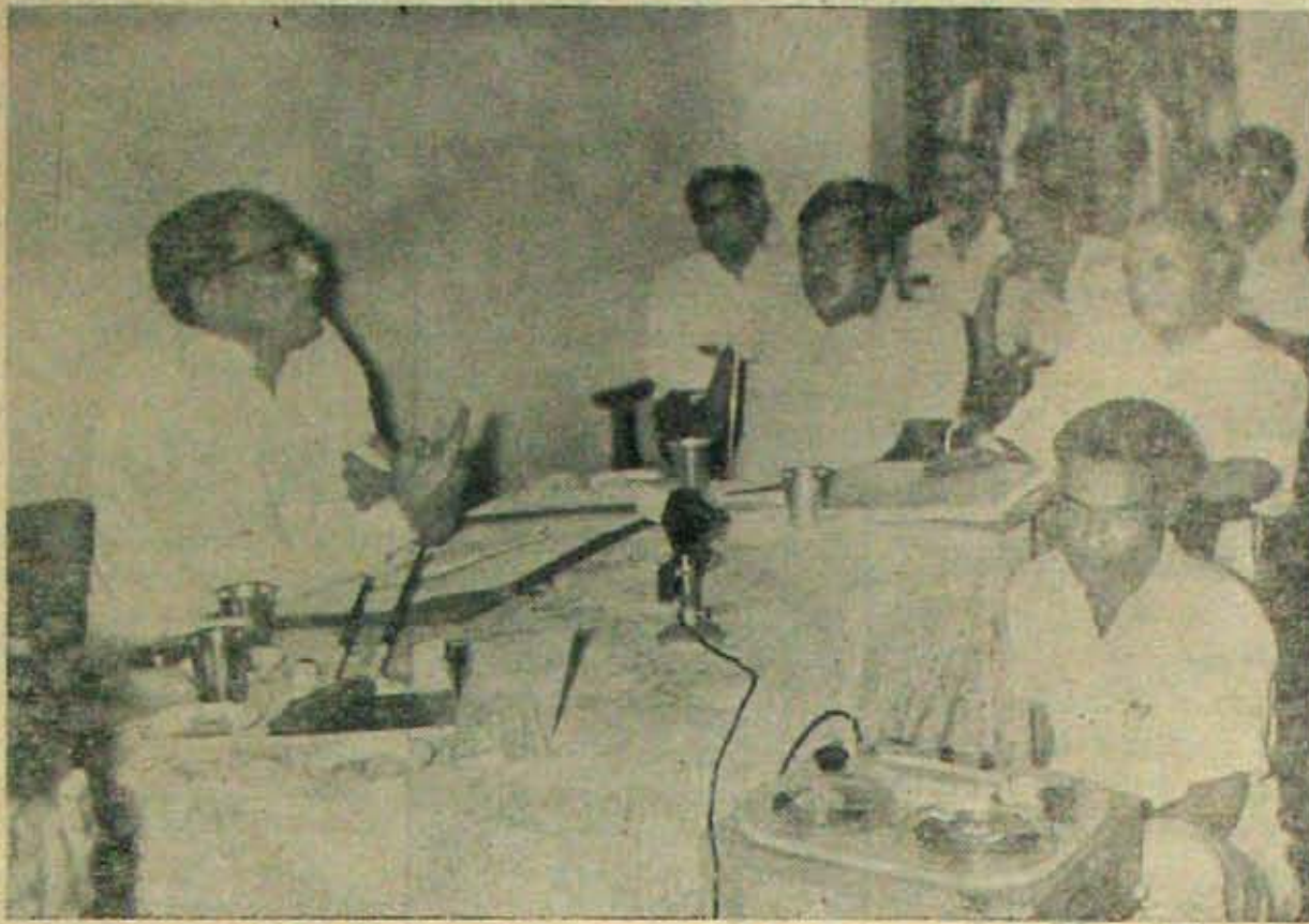
మంత్రిగా శ్రీ ఆనం వెంకటరెడ్డి నెల్లూరులో పాల్గొన్న తొట్టతొలి కార్యక్రమం కలెక్టరేట్‌లో అధికార సమావేశం. ఆ దినము జరిగింది.