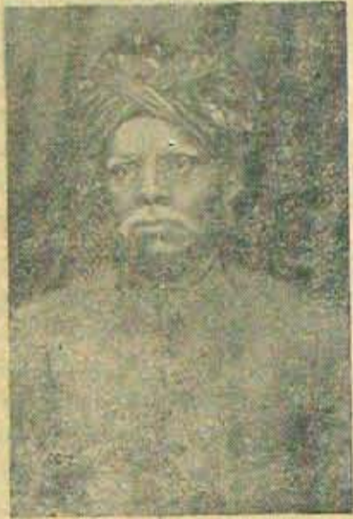
గూర్చి చెప్పదగినంత, చెప్పవలసినంత పంతులుగారు చెప్పేస్తారు.

అధికారాలు నిర్వహించారు; కావ్యాలు కృతించారు. మొదటిదానికన్నా రెండోది వీరేశలింగానికి సంతోషదాయకం అయి ఉంటుంది. కవుల చరిత్రలో వాళ్ళను