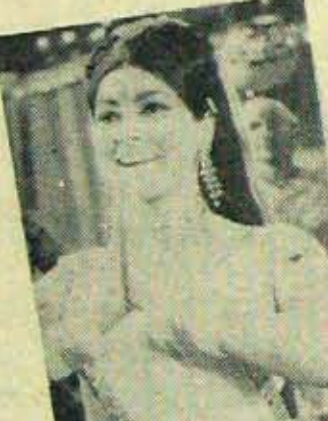
'బంగారుబంబి' నిర్మాత రూపాంబులక మనో మేలిమి బంగారు బంబి!

ముగ్ధతనం విడిచిపెట్టి తెలుగుదనం బలికిపెట్టి పవిత్రతపెదజల్లుతూ ఆంధ్రుల ఆడుపడుచులు అంధుల ప్రస్థాపతికి రవ్యమైన సూక్ష్మతకు మనుతాకు బంధాలతో రూపాంబులక ప్రతిబంబం! ఆంధ్రుల ఆరాధ్య దైవం గోమాత అమ్మవారును అందమైన ప్రతిరూపం!