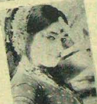
భూటం ఎన్. రాజేశ్వరరావు రంజిట్ బాల్లముంత సీతామధుస్థాని నిర్మాత వాసిరాజు ప్రకాశం ప్రీతిపై దర్శకత్వం కూర్చు కె. సత్యం మమతా కంబైస్సు