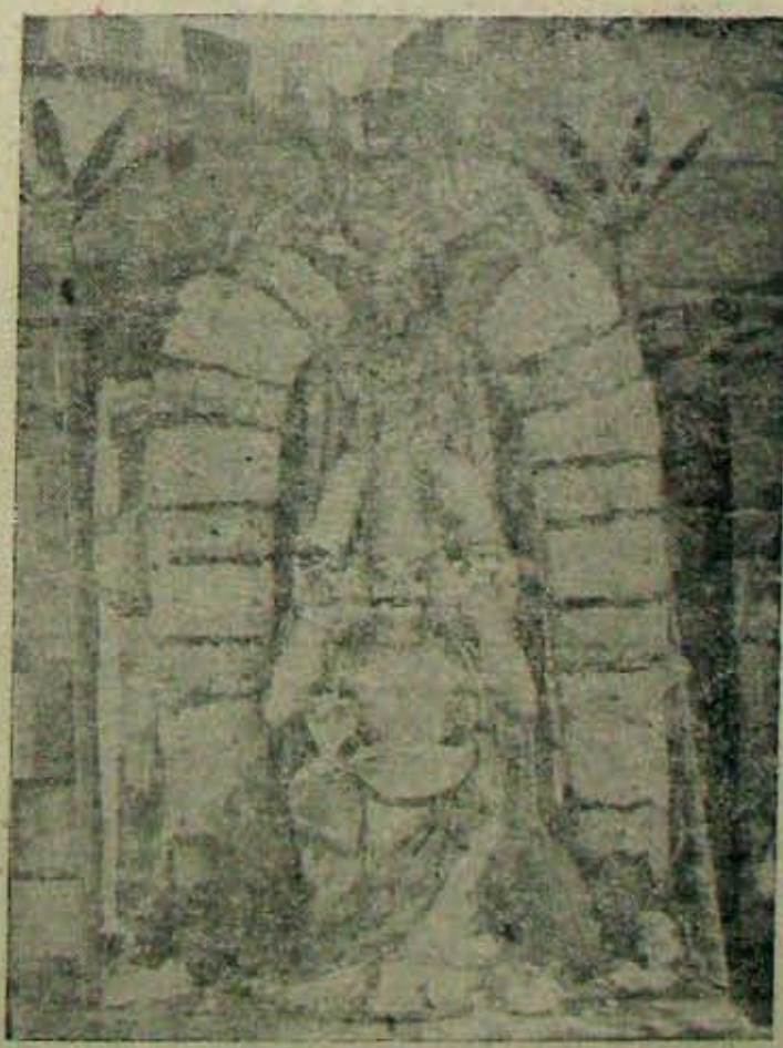
బంగారు గరుడవాహనారూఢులైన శ్రీ నరసింహస్వామి