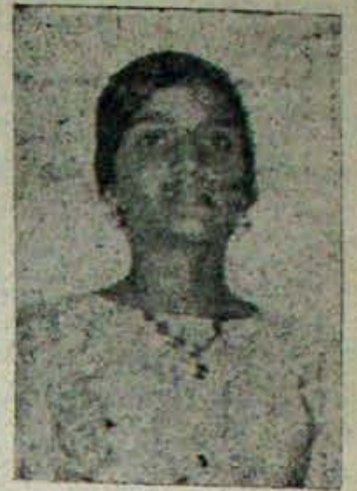
అభిగ్యు ధోరణిమూలం కళ, చంద్రిక