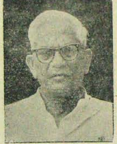
స్థాన చలనమా? శాఖ చలనమా?

బాన్ నెలలో ఉభయశాసన సభల బడ్జెటు సమావేశాలు జరుగుతాయి. శాసన మండలికి ఎన్నికలు ఆఖరువారంలో జరుగుతాయి. బాన్ ఆఖరు వరకు బడ్జెటు సమావేశాలు జరుగవచ్చు. అంటే శాసనసభల మధ్యకాలంలో కొత్తమంత్రి నియామకం జరగక పోవచ్చు. సమావేశ కాలం పూర్తయిన వెంటనే కొత్త మంత్రి నియామకం జరుగుతుందని అందనా వేసు