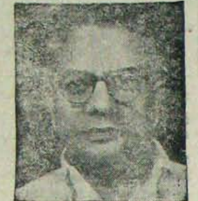
79 ఏట ముద్రాసులో కాలధర్మించెందిన భారత మాజీ అధికమంత్రి టి. టి. శృష్టిమావారి

వాటర్ గేట్ గోడవలో ఆ మెరికా అభ్యవైసని సతమతమవుతున్నా విలేజింగ