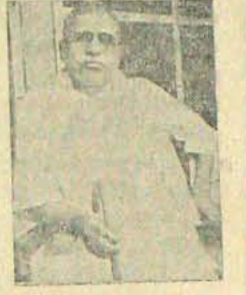
నివాసి తెలుగు జర్నలిజానికి సూర్యోదయ పరిశ్రమలో ఉందివాని, దానికి తగిన గుర్తింపులేదు. గుర్తించేవాడు, గౌరవోక మాదిరి ఏమగుటోడు. గూలేని కురచదనాన్ని కూడా అది దాటలేకపోయింది. ఇతే ఒక