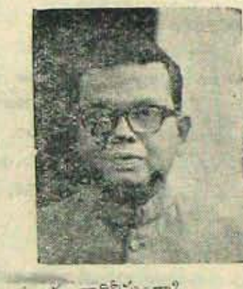
వీరి ప్రవేశం - వీరి నిమగ్నములకు దారితిస్తుందా?

అవుతుందా అని సందేహం వెలిసిచ్చేవారి కిది ప్రధాని మనోవైఖరిని తెలుసుకోవడా నికి సూచిక కావాలి పాతవారిసందేహిని అయి వడలుకోవానుకోవడం లేదనడాని కిది నిదర్శనం. అయితే రాష్ట్ర శాసనసభా కాంగ్రెసు పార్టీ నాయకత్వం ఒకయంలో అవలంబిం దిన ఈగినలాట విధానాన్ని గర్హించినట్లు సూచన అంతవలకు మాటి ముఖ్యమంత్రి