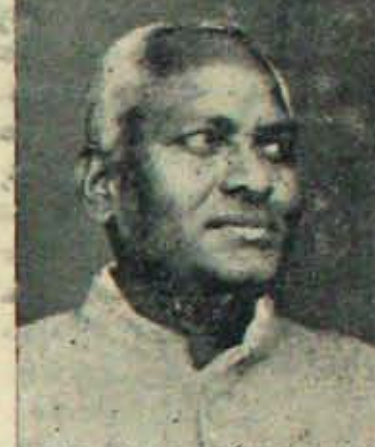
ఆరోగ్యమంత్రి శ్రీ రాజమల్లు

మందిరని, ప్రజలకు ఈ ప్రజా ప్రజా వి కల్పించవని, మంత్రమంటే ఇట్టే కట్టు వచ్చి వచ్చులుకావలసిందేవని, అంగరేవనడం నిర్దిహదం. అది సీతి తో, ఆక్రేత పక్ష పాతంతో ఒక్క కంపుకొడుతున్న ఆరోగ్య