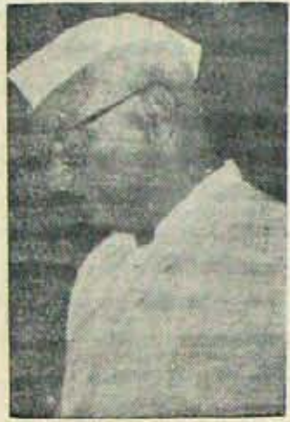
మంత్రివర్గ నిర్మాణంలో 'సముదిక' పాత్ర?

రాష్ట్రపతి అన బునహా గత్యంతరం లేవనే చెప్పకూడదావడమే యీ సందేహానికి అస్సాదం ఇచ్చింది. ఆంధ్ర వేర్వారు కాంగ్రెసువారులు కోరినవి, తెలుగాణా