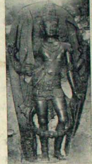
సూక్ష్మారుపేటలో బయటబడిన వీరభద్రుడు

ఈ శిల్పకలో మరొక నిలువెత్తు శిల్పా ద్వితీయాంశాలు చోటి మామృత్తులు. ఇటీవల సూక్ష్మారుపేటలో మైసూలు తీవలచాయన ఇల్లు కట్టించుకొడానికి పుగా నులు తెలుస్తుంటే ఈ ద్వితీయాం అమ్మల వడివటం. నిమన్వర అడుగువెత్త, 38 అంగుళాల వెడదవార్లైన ఈ స్తంభాల ద్వితీయాం మెడలో పుర్రెంకూ, చేత్తో కత్తిగిచ్చి చూచి అది ఏకల్లో పింపాణోనని తయవత్సరకు మనజనుంగకు. మనకెండు కొద్దిన వెడదరా చే పుడా అని దాన్ని కద్రంగా మోసుకెళ్ళి తెరువులో వాతవెర్తి వచ్చాడు. ఈవార్త అగోబా అనోబా పోక్కి, కొందరు హరిజన యువకులు తెలిసింది. వాళ్ళు ఉక్కాహంతో, కట్టగట్టు కొనివెళ్ళి ఆ ద్వితీయాం లోడి, కమ హరి జనవాడలో ఒక కట్టని పందిరేయించి, అందులో దాని ప్రతిష్ఠించి, పూజావునస్సా రాలు జరిపిస్తున్నారు.