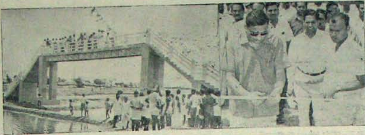
కావలితాలూకా కుమ్మలమెంజిన వద్ద బకింగ్ హాం కాల్పులైన నిర్మించబడిన కాళిబాటవంతెన-పూర్వం పోర్టువ చిహ్నంగా.