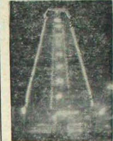
మాజీ మంత్రి సభకు అడిగిన అలంకరణ కో పాతికవంతుకూడా లేదు కంకడి! కంకడి కలెంటు వందర్చులో వినుకోతో అయగోవు కాలంకర్ణాళం

ఈ విశ్వకోత వైరవార్ని కల్లారాచూడండి! మాజీ మంత్రి మునుస్వామి రాకకోసం వెయిడిచాలలో వేదికను వి.ఆర్. హైస్కూలు మైదానమిడి. అంకా బారుకీరిన బార్ రైట్ కోత కదికళంకోలేదు. ఈ కలెంటు ప్యూచార్ని మాస్ట్రీ ఈ రాష్ట్రంలో కర్నూల్ కొరక వుండటం ఏరైనా ముఖ్యకారా!