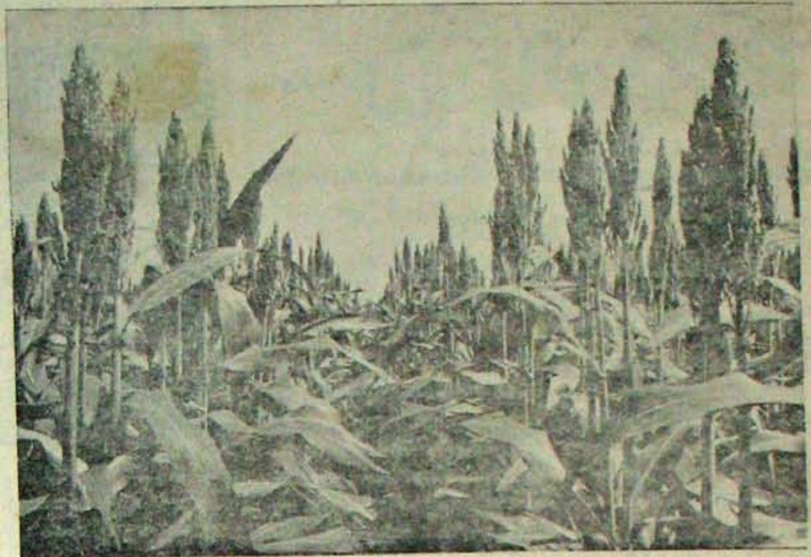
బ్రహ్మాండంగావున్న హైబ్రిడ్ జొన్నపైరు సుందర జొన్నకు ఇది మంచి అదను

3. పొటాషు ఎరువులు - 580 మెట్రిక్ టన్నులు (పొటాషు రూపములో) పైన చెప్పిన ఎరువులలో మూడవ వంతు ఎరువులు కాంపైక్టు ఎరువులుగా ఉండవలయును. బొద్దువారిపాలెము, చాకలపల్లె, వడగు పాడు గ్రామములలోని పొలములలో నత్తజని, భాస్వరము, పొటాషు తక్కువగా వున్నవి. ఈ పొలములలో ఈ మూడు