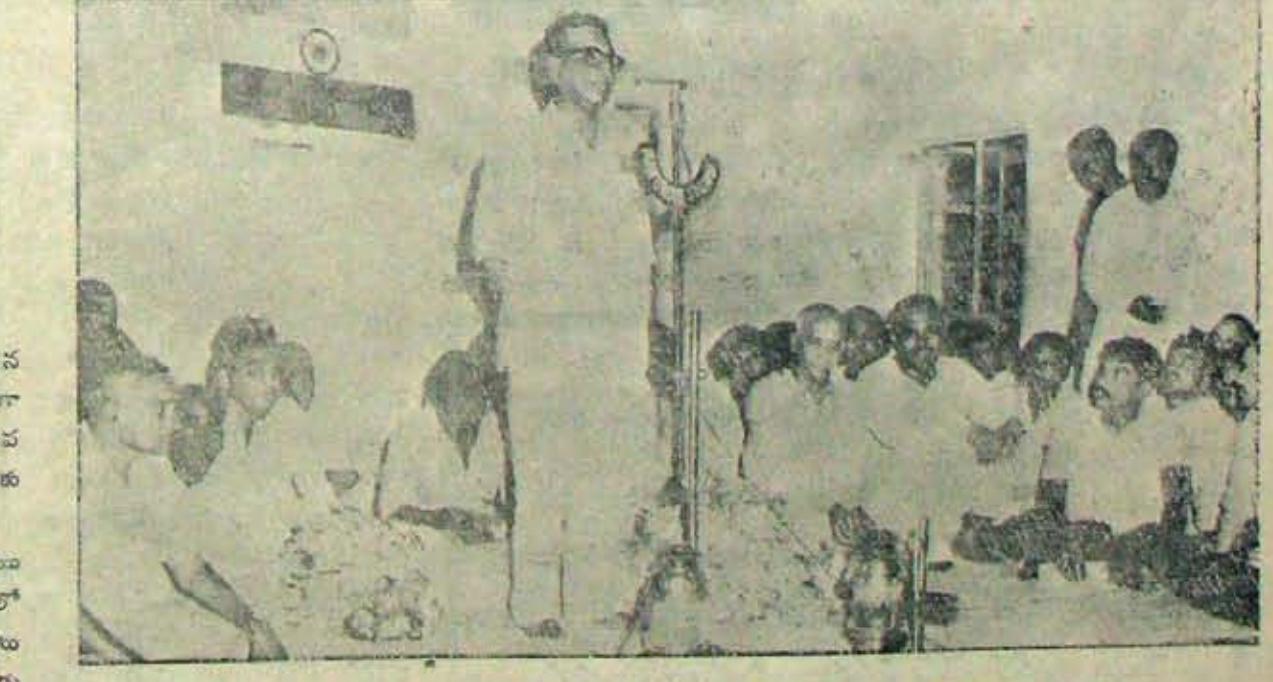
జి. నంజీవరెడ్డి కార్మిక 'జాతర'లో కేంద్ర కార్మిక మంత్రి శ్రీ రఘునాథరెడ్డి

రూపొందించడానికి కలా శ్రమించిన వాకు అనాడు అయిదు వ్యతిరేకంగా నేర్పాటుగాదిగా నేటి కేంద్ర కార్మిక ఉప మంత్రి శ్రీ జి. వెంకటస్వామి సమ్మెలకు నాయకత్వం వహించాడుకూడా. ఈ నాడు పరిస్థితులు కారుమాంకం నాయి. వెంకటస్వామికి కేంద్ర ప్రభుత్వంలో కార్మికమంత్రిత్వము లలిందింది. వేర్పాటు వేద్యమం తిప్రస్థాయిలో వున్న నారు తెలుగాణా మంత్రి అంకన సేవరెడ్డి నేను కార్మికవాయకుగా మిగిలిగాడు. కేంద్రమంత్రి అయిన నాటినుండి శ్రీ వెంకటస్వామికి హైదరాబాద్ కారకదేశ ముగా కనవడింది. ఎన్ని సగ్గానాలు; ఎన్ని మహాసభలు! మాజీ ముఖ్యమంత్రి ఏ. వి. కి వేర్పాటుగాదులపై రాళ్ళువచ్చి దానికి ఎంక గానో ప్రయోజనవచ్చాడు. కీర్తిలేవుడు నంజీవరెడ్డికారంపే హితుకుగా అయిన రాజీమా ప్రవేశం దాలామందికీ తెలుసు. కేంద్ర కార్మికమంత్రిగా నంజీ