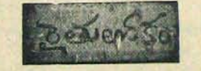
హెక్టారుకు రూ 12,500 ల అవాయం

కృతు అంకగాలోను నూ దీనిలో డయో నైనిన్ ఒక మోస్తరును డి ఎక్కువగాకూడా అలింబుతుంది. ఈ కలప వంటద్యారా రైతులు హెక్టారుకు విదాటికి రూ 12500ల అవాయము తి వచ్చును. ప్రపంచములో డయోనై స సరఫరా రిమితముగావు డి. అంతేకాక సహజముగా 10 చే డయో నైనిన్కూడా తక్కువే. అ డి కేనే రైతులు ఈ వంటను విస్తృత ముగా ప డిసి లాభము పొందవచ్చును.