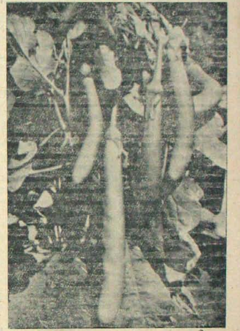
అన్నపూర్ణ పరిశోధనా కేంద్రం వంగ - ఈ కొత్త వంగ రకాలను గిరింగి గతవారం పాఠశాలకు బదిలారు.

కొత్త పండ్ల రకాలు వ్యవసాయంలోని అనేక రకాలను డి డి నూనూ 1000 కొత్త ద్యాక్షరణాను సేక రించామనీ. వీటిను డి 6000 వంక ద్యాక్షరణాలు రూ పొందించ బడినాయని చెప్పారు. అరటి, ప్యానికెరీ, నూమిడి, బామి, అనాసలో అనేక కొత్తరకాలు ప్ర్యేత - కొం 9 వ పేజీ