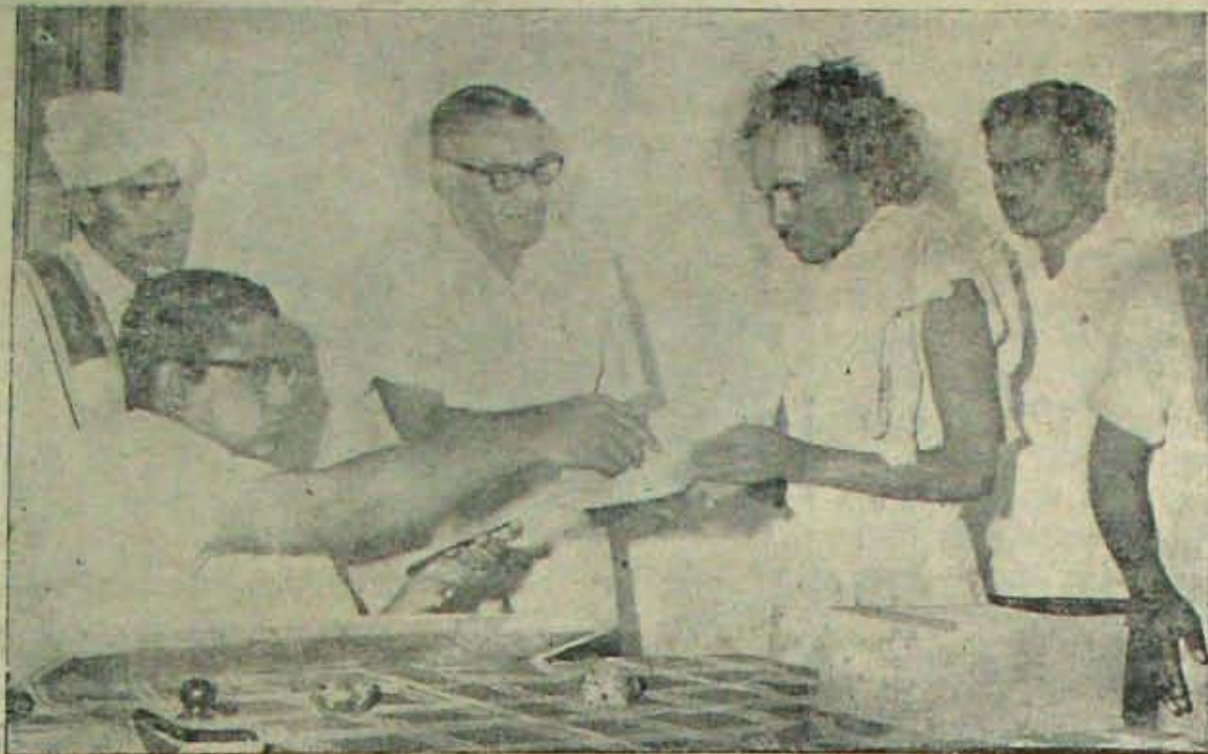
కల్లెరు శ్రీ పార్లసారథి మొత్తానికి ఢిల్లీలో పెద్ద సుడిగానే సృష్టించారు. ఒక్క కాణాదు, ఒక్క రంగంకాదు, ఒక్కవని కాదు - నలముఖాల దొడెత్తుతున్నారు; తరుముతున్నారు; కలకలం కల్పిస్తున్నారు. మూటకూళ్ళతో కల్లెరులు బుగ కాణాడు మూగుతున్న వేలాది పేదలనూర్చుచున్న పార్లసారథి వాళ్ళకు వీధి అకారేణ కనబడుతున్నదేమోననిపిస్తున్నది. వట్టాల పంచకం పార్లసారథిని నిత్యకార్యక్రమాల్లో ప్రధానమైనది. వెంకటగిరిలో ఆగస్టు 30 తేదీ దాదాపు 400 వట్టాలుపంచారు. ఆ పంచకద్యక్యమే ప్రైవేట్. మధ్యనున్నవారు తోల్లారు వెంకటగిరిపాలెం.