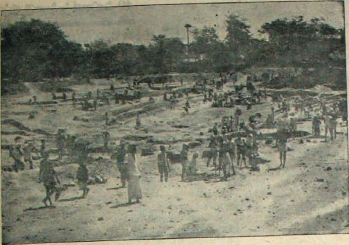
జిల్లాలో సమీక్షలోని అనేకమంది, సర్కారుపాఠశాల గ్రామాలకు విద్యక నిధి ఆధారమైన రామిశిక్షణకు ఎందిపోయింది. కరువు వనుల కల్గినచే మంతారు చేయబడి రోజు 350 మంది కూలీలు దాన్ని లోతు చేస్తున్నారు. మొత్తం కాలాకాలలో దుర్మమైన, దుస్వహమైన నిధి కరువుకు ఇది ఒక సామర్థ్యం మాత్రమే!