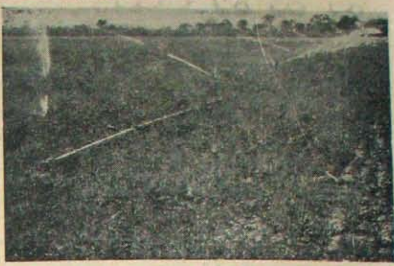
వరిపైరుకుతప్ప- తక్కిన అన్ని పైర్లుకు తక్కువ లాభకారి స్ప్రి కర్ అరిగేవకా (80 ర డిమ్మే వర్షంలో నీటిపారుదల). తక్కువనీళ్ళతో ఎక్కువసాగు సాగుచేయవచ్చు; కూమి చదరంగా వుండవలసిన అవసరంలేదు; రసాయనిక ఎరువులను నీటిలో కలిపి పైరుకు అందించవచ్చు. ఈవిధంగా ఎన్నో వ్యవయోగాలు, ఎ.తో అవాచిం; కాని పెట్టుబడి ఒక్కటే సమస్య!

కనీసం దినపాదు కైతులు కూడా యీ వివన ప్రభావితులు కాలేక పోతున్నారు. ఎందుకు ఈ కష్టనం దిన్న రైతులందరికీ చేరక, పెద్దవారికి అడుగులు ముడుగు లొత్తుకుంది? అర్ధి స్థామక లేకపోవడం, అవకాశాలు అందకపోవడం, శాస్త్రీయ విజ్ఞానం లోపించడం, లాభ సాధిగాని దిన్నకమకాలు కల్గివుండడం ఈ స్థితికి ప్రముఖ కారణాలు. దిన్న రైతుల పరిస్థితే యిలాగుంటే, యిక వ్యవసాయ కూలీల మాతేమిటి? వ్యవసాయ కూలీల పరిస్థితి వరి దుర్భాగం. మీకి సాయంచేసి నాడుతేలేడు. ప్రభుత్వం, వ్యవసాయశాఖ, సమితులు యిలాలు అందిస్తున్నవేమిటి? దివ ర క క పోతుంటేమి న బ్యాంకులైరా మీ అవస రాలను గమనిస్తున్నాయో? సమితుల్లో యిచ్చే ప్రోత్సాహాలు ఎవరు ఎగరేసుక