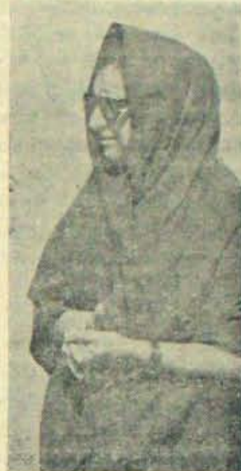
ముంచినా, తేల్చినా మీదే భారం!

ఏది ఏమైనా, ఎవరు ఎటుపోయినా ముక్తిని బంధనలు అక్షరాలా పాటించి తీరాలి అంటే రాష్ట్ర సమైక్యతకు ముప్పు వాటిక తప్పదు. ముక్తిని బంధనలకోసం