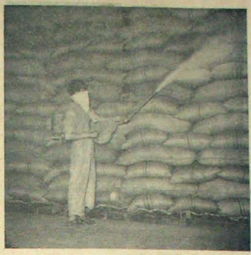
వేరహాసింగ్ కార్యరేషన్లో ధాన్యంపైలకు పురుగులు వట్టకుండా మందకొట్టన్న దృశ్యం.