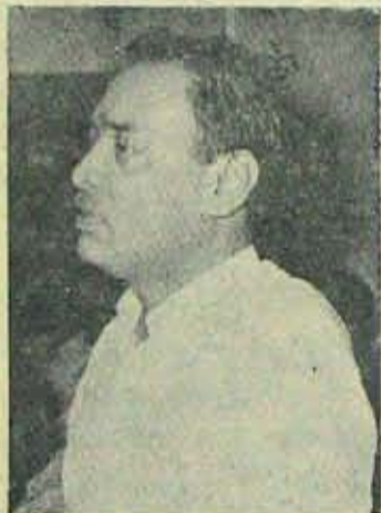
ఈ పరిశీలలో నెగ్గాలి- సమైక్యతను నిల్పాలి!

అజగదొక్కడంకాని సహించరాదని గొన దాలిచ్చేవారే! అంతేకాని, ఈ సమస్యకు పరిష్కార మార్గమేమిటి, ఈ అవాంత రాన్ని అధిగమించే దారి ఏది అని ఒక్కరూ