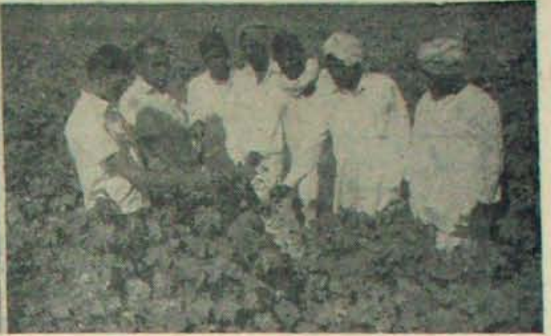
రాయచూరు వద్ద రైతు బృందం చూస్తున్న హెచ్. బి. 4 పత్తిచేను