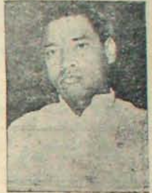
ఉద్రేకాలు వద్దు.... వాస్తవికత కావాలి!

భూ పరిమితుల సమస్యను తమవూటా కానంగా చెల్లించుకో గలిగిన అధికార నాయకులు ఎంత తేలికగా, యువగా తీసుకుంటున్నారో చూచినప్పుడు అనేకన కళ్ళుతుంటే. అనేక కష్ట సమస్యలతో కూడిన ఈ విషయాన్ని, కోట్లాది రైతాంగ దావ బ్యక్తులకు సంబంధించిన ఈ విషయాన్ని, దేశ సాధారణ సాధానికి వువాది అయిన గ్రామీణ వ్యవస్థ భవిష్యత్తుకు సంబంధించిన విషయాన్ని తీవ్రంగా ఆలోచించకుండా, లోతుగా పరిశీలించకుండా, సమగ్రంగా విచారించకుండా, వాస్తవికతను తోచుకోకుండా - తేవలం రాజకీయంగా అల్లొక పోవడం గమనించినప్పుడు, విచారం కలగుతుంది. ప్రజాప్రతినిధుల నిర్లక్ష్యం, అవకాశవాదము; రైతుల చైతన్య రాహిత్యము - వీధి చెడును సూచిస్తుం దేమోననిపిస్తుంది.