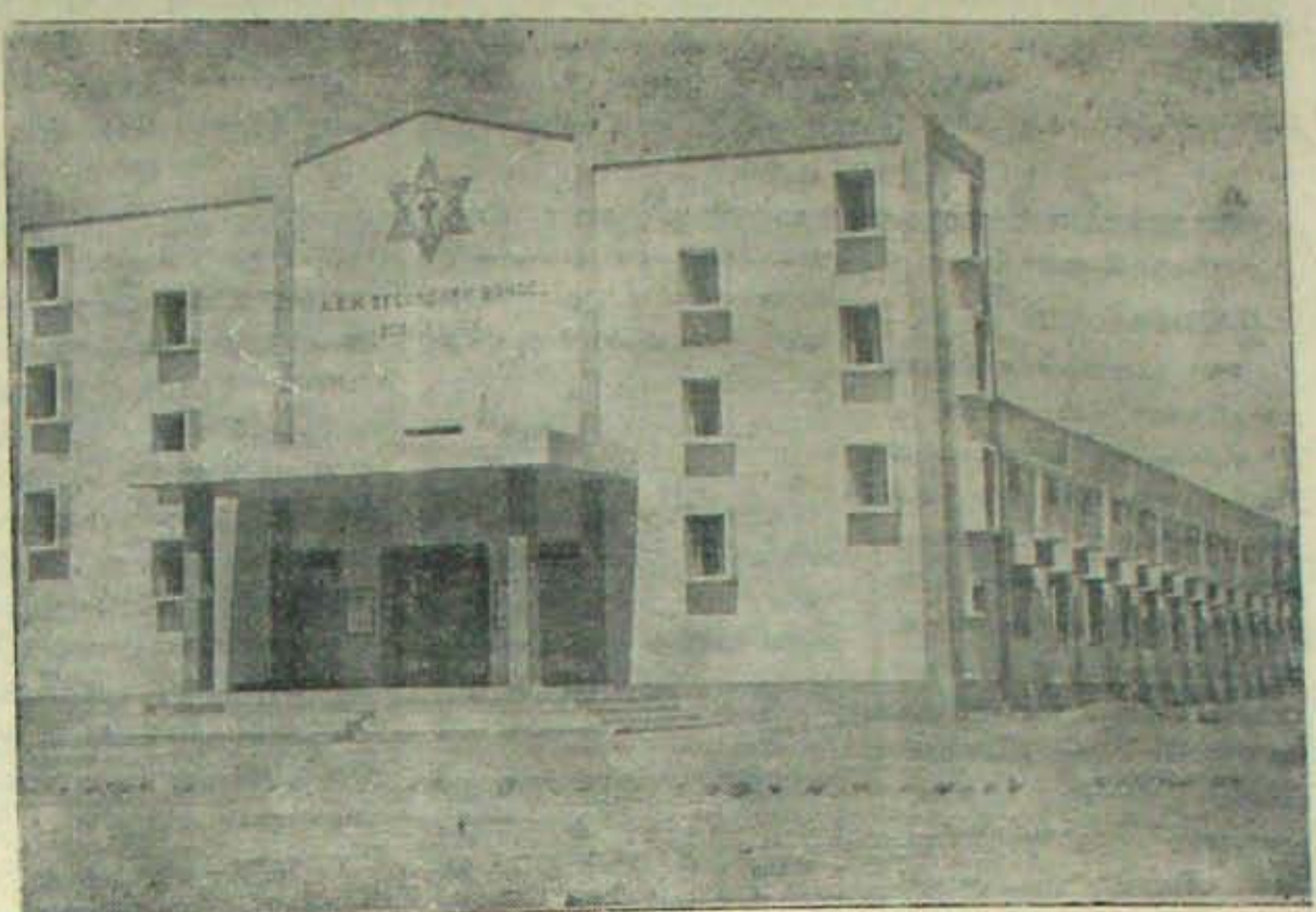
కావలి ఎ. వి. ఎం. సెకండరీ స్కూల్లో 'సి డ' వారి 2 లక్షల 60 వేల రూపాయల విరాళంతో నిర్మించబడిన సైన్సు భవనం

కరువు, వరదలు వచ్చినప్పుడు తప్పమన పట్టణాల్లోకన్నా వల్లెలో పేదరికం తక్కువగా వుండటాడు. వల్లెవల్ల తిరిగి సేకరించిన ట్యాంకో అన్నమాటంది. బోపి