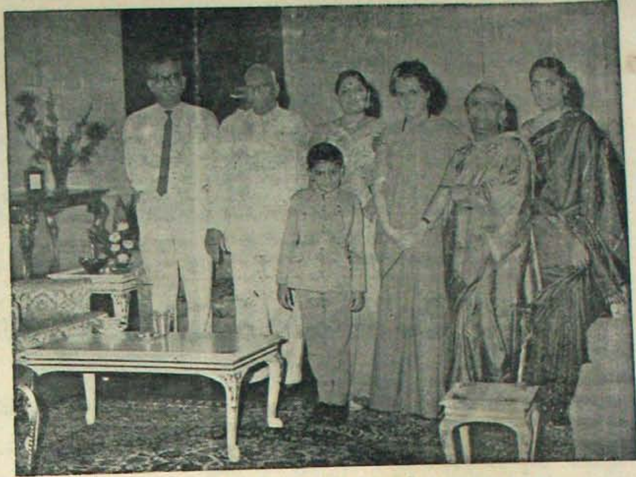
ఎడమవైపు మొదటివర్గీ స్వర్ణము వెన్నెలకంటి గోపాలకృష్ణ - శ్రీ గిరి దంపతులు, కమారైలు, ప్రధాని ఇందిరాగాంధీకూడా ద్వితీయ వర్గంలో వున్నారు

8 తేదీ విటికి కొద్దిగా నీళ్లు వచ్చాయి. ఇది తెలిసి, తెనాలి నీళ్లుకాదు; ప్రవాహం