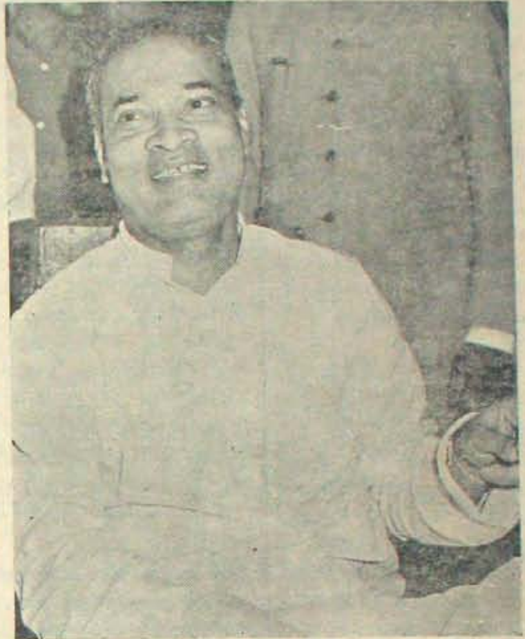
బాదుకు రావలసిందిగా కోరారని తెలుస్తున్నది ఈ విధంగా నెల్లూరు జిల్లాలోని ఒక మాజీ శాసనసభ్యుడికి కూడా పిలుపు వచ్చినట్లు తెలిసింది. కాని ఎన్నిక పరిణామాల మీద పథకాన్ని తారుమారు చేసినట్లుంది. —కొరవ 7 వ పేజీలో

నకురావు. అందువల్ల అంజీయ్య వర్గంవారు చల్లగా నడుతున్నారు. హైకమాండుకూడా ప్రతి రాష్ట్రంలో పాత ముఖ్యమంత్రులనే కొనసాగిస్తున్నది. అటువంటప్పుడు అంధ్రలో మా క్రం ఎందుకు మారుస్తారు? అంజీయ్య వర్గం సర్దుబాటుకు ఇదికూడా ఒక కారణంగా వుండవచ్చు. నాయకత్వం మారాలనే అంజీ శన వెనుక బ్రహ్మానందరెడ్డిగారి అదృశ్యహస్తం కూడా వున్నదనేది అందరికీ తెలిసిందే. ఫలితాల ప్రకటనకుముందు బ్రహ్మానంద రెడ్డిగారు వివిధ జిల్లాలలోని తన అనుయా యులనే వారందరికీ పోస్ట్ శాకరి, తమ మద్దతుదార్లవరో అ వివరాలతో హైదరా