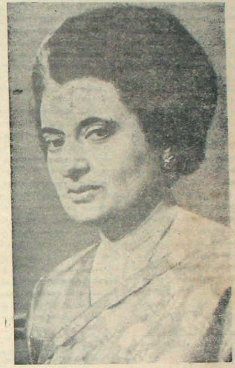
కాని, కొంతవరకు ఆ పార్టీ గాంధీ ప్రకటనలకు, దాని కార్యకర్తల, ప్రతి నిధుల మాటలకు - చర్యలకు సంబంధం కుదిరితే, అది నెట్టుకపోగలదు. సిద్ధాంతాలకు వైర వామపక్షం గతి ఏమైనది? ఆట్లని సిద్ధాంతరాహిత్యం అవలంబి నియమితే, మోక్షం వస్తుందని అనుకోరాదు. —కొరవ 10 వ పేజీలో

అటువంటిప్పు అనగా నడిచిన కార్యకర్తలను, కానసమస్యలను ప్రసాదించలేని రాజీయ పార్టీ నిర్వీచ్యంగా తన శక్తిని నడిపించగలదా? సిద్ధాంత రీత్యా, నడిపించలేదు.